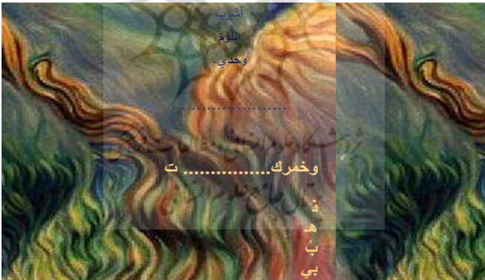
الشاشة الخامسة من قصيدة: قالت لي القصيدة ضوءها العمودي