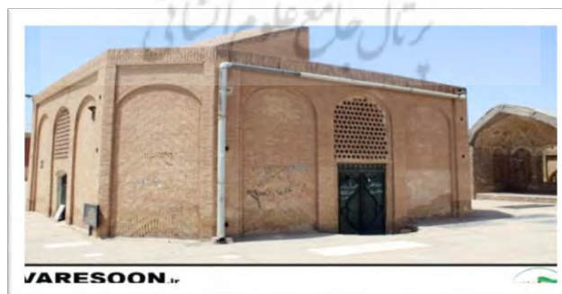
تصویر ۳: نمای بیرونی آرامگاه آیت‌الله العظمی علوی بروجردی (ره)