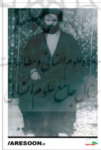
تصویر ۱: آیت‌الله العظمی سید محمد علوی بروجردی کاشانی (ره)

واکاوی شخصیت علمی، اخلاقی و اجتماعی آیت‌الله سید محمد علوی بروجردی (ره)