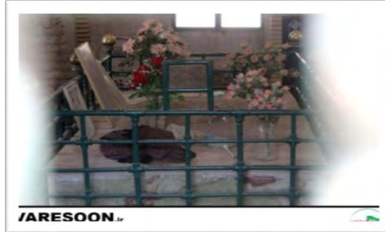
تصویر ۴: نمای داخلی آرامگاه آیت‌الله العظمی علوی بروجردی (ره)