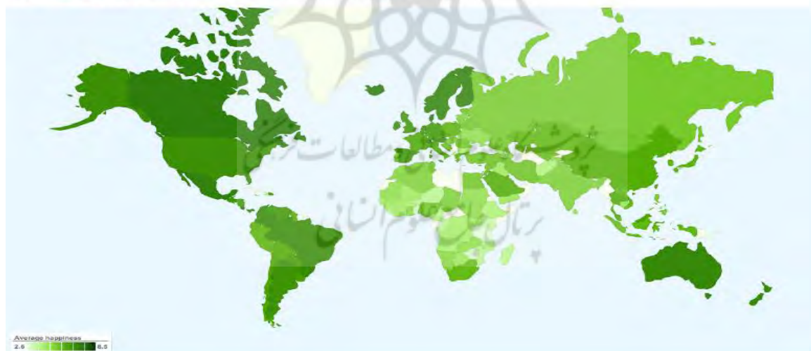
شکل ۱- پراکنش گرافیکی وضعیت شادمانی در جهان

How much people enjoy their life-as-a-whole on scale 0 to 10