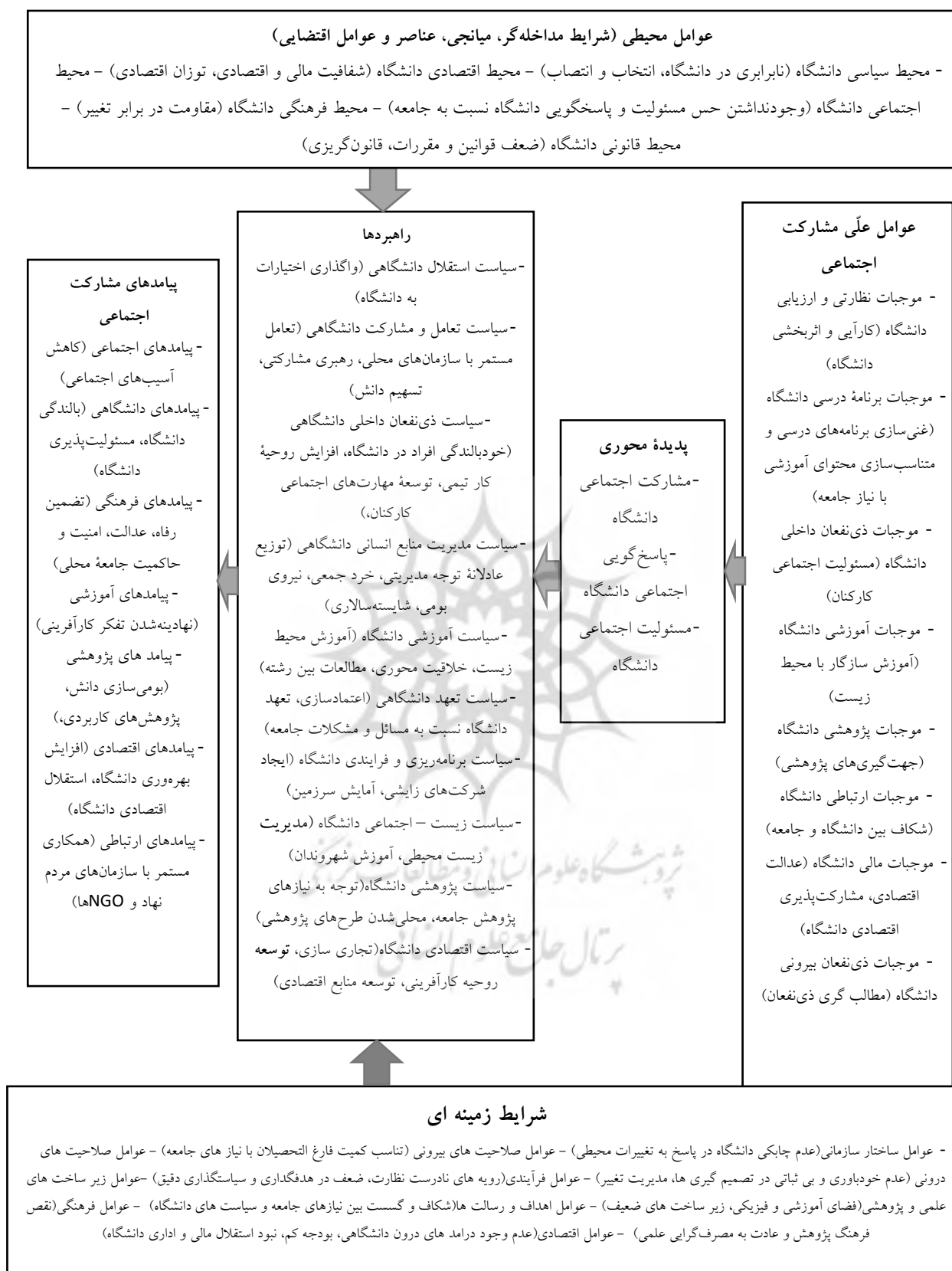
Fig 1- Selective coding: University social participation model