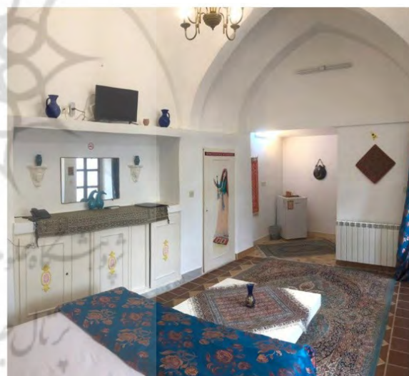
تصویر ۱. زوایای مختلف یکی از فضاهای اقامتی هتل سنتی نگین.

پتو می‌پوشاندند تا هوای زیر آن گرم بماند. افراد خانواده دور کرسی می‌نشسته‌اند و پاهای خود را برای گرم شدن زیر کرسی می‌گذاشته‌اند. همهٔ خانه‌ها در زمستان، حداقل در یک کرسی می‌گذاشته‌اند. - درست کردن لواشک و میوهٔ خشک، خواب شب تابستان و در هنگام عروسی‌ها، نگاه کردن از بالا به حیاط و کوچه در مسیر جهازبرون از فعالیت‌هایی است که در پشت‌بام حادث می‌شده است.