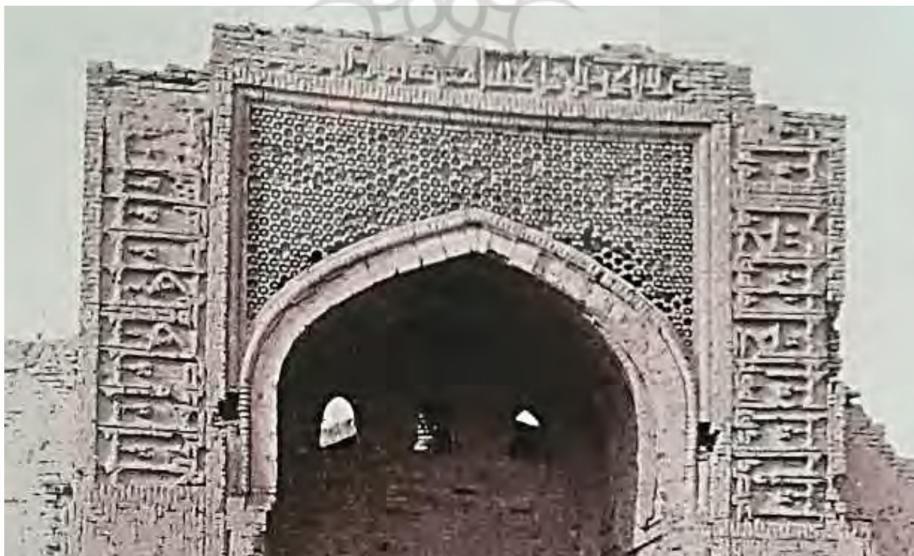
تصویر ۱. ایوان ورودی و کتیبه آجری دورتادور آن قبل از فروریختن ایوان، به خط کوفی گلدار، رباط ماهی.

با قدرت‌گیری آل بویه در سرزمین‌های غربی ایران، نگاه ویژه سامانیان به ری، روابط متشنج این دو دولت شکوهمند و بافرهنگ ایرانی، وجود خاندان‌های جنگ‌سالار چون «چغانیان» و «سیمجوریان»، کشمکش و درگیری‌های