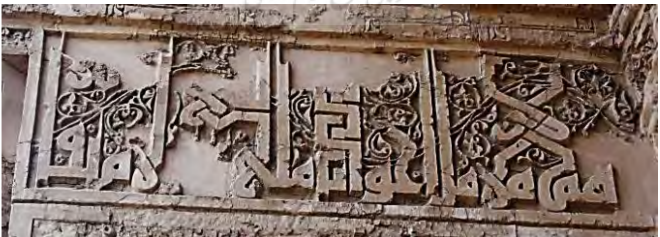
تصویر ۱۰. کتیبه گچی سمت راست ایوان دوم که به کلمات عربی ختم می‌شود، به خط کوفی معقد، رباط شرف.