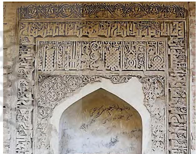
تصویر ۱۲. کتیبه های گچی محراب ها، آیه ۲۵۵ بقره، به خط کوفی برگردار (مورق)، رباط شرف.

همگی کتیبه های کوفی و حتی ثلث رباط های بررسی شده بدون نقطه اند. از نظر شیوه نگارش در سردرهای رباط شرف و ماهی دو نوع خط وجود دارد؛ در رباط شرف و ماهی خط درشت (جلی) که با استفاده از آجرهای بزرگ، سردرها را دور می زده و در طرفین سردرها نیز ادامه یافته است. دیگری خط باریک و ظریفی (خفی) است که به صورت افقی روی طرح هندسی سردر ایوان انتهایی (شرف) و ایوان اصلی (ماهی) نگاشته شده اند. قابل توجه این که درشتی خطی که سردرها را دور می زند با خط ظریف بالای پشت بغل ها و طرح هندسی آنها رابطه ای بسیار موزون و هنرمندانه دارد. در رباط ماهی خط ظریف درست در بالای سردر ورودی نگاشته و در دو طرف سردرها از خط درشت