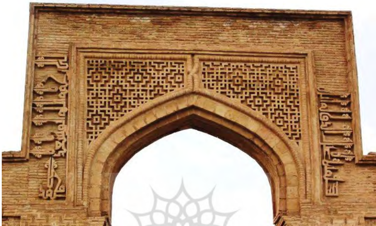
تصویر ۶. کتیبه آجری دو طرف ایوان (ورودی) اصلی، به خط کوفی گلدار، رباط شرف.