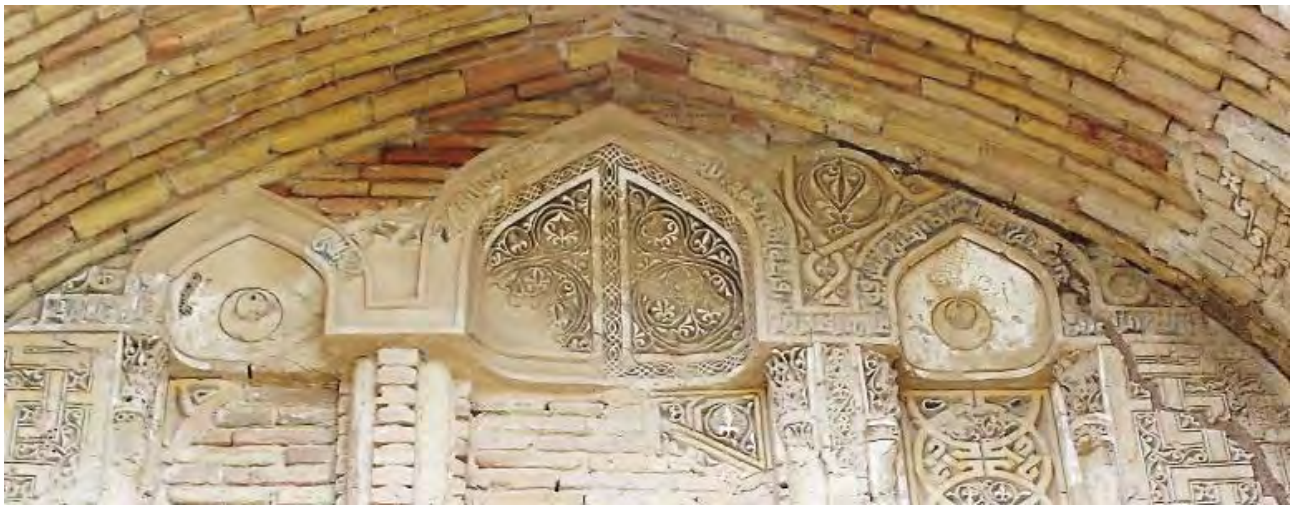
تصویر ۱۱. کتیبه گچی داخل ایوان دوم، آیه ۵۳ زمر، به خط کوفی ساده، رباط شرف.

« /... / عمل ابی الحسن /... / » که احتمالاً حاوی نام یکی از سازندگان اصلی بنا بوده، باقی مانده است (ibid, 41). ۳- دو کتیبه گچی مخدوش شده در ابتدای قوس تاق ایوان و درست در بالای ابتدا و انتهای کتیبه ثلث ایوان سوم مشاهده می شود. این دو کتیبه به خط کوفی معقد بر زمینه اسلیمی از گچ ساخته و قالب گیری شده بودند (تصویر ۱۴) که آندره گذار به آن اشاره ای نکرده است.