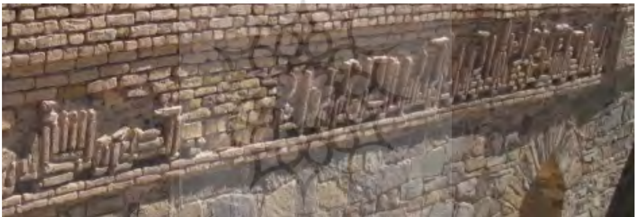
تصویر ۴. کتیبه کوفی گوشه‌دار گچی محراب (آیت‌الکرسی)، رباط زیارت.

۱- در شبستان مسجد رباط بر پاکار پوشش‌ها کتیبه آجری کوفی به عرض یک متر نقش بسته است. شبستان تالاری مستطیل‌شکل به ابعاد ۴/۵ × ۱۵ متر است. کتیبه در ارتفاع دو متری پس از چیدن دو رج آجر در داخل یک قاب که با عقب‌نشینی آجرها ایجاد شده و تالار را دور می‌زده، ساخته شده است (همان، ۴۷). بر دیوار شمالی آن آیت الکرسی (بقره، ۲۵۵) و بر دیوارهای جنوبی آن نیز بقایای کتیبه‌ای