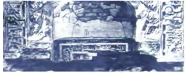
تصویر ۱۳. کتیبهٔ گچی درون محراب، به خط کوفی برگدار (مورق)، رباط شرف.

از نظر جنس، تاریخ و مضامین، کتیبه‌ها در بُعد تاریخی