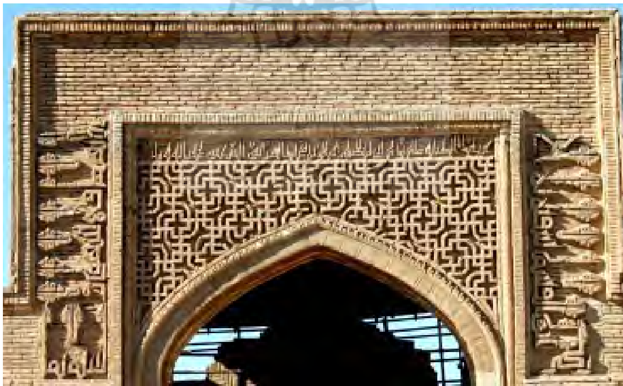
تصویر ۷. کتیبه آجری دو طرف ایوان انتهایی، به خط کوفی گلدار، رباط شرف.