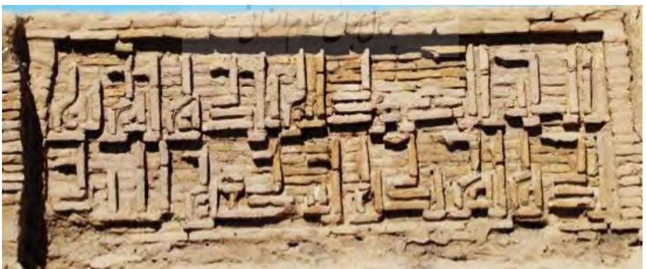
تصویر ۵. کتیبه کوفی گوشه‌دار گچی محراب (سوره توحید)، رباط زیارت.