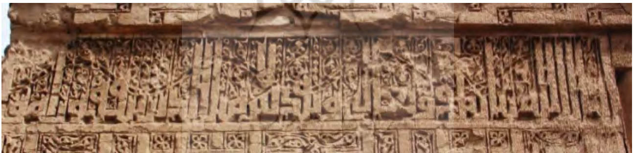
تصویر ۲. کتیبه گچی سمت چپ ایوان ورودی، رباط ماهی.

۳- کتیبه داخل ایوان ورودی: در دو طرف پایه های ورودی ایوان رباط، هم اکنون کتیبه ای گچی به خط کوفی غیر از آنچه در تصویر عبدالله قاجار دیده می شود، وجود دارد. این کتیبه سه طرف داخل ایوان را دور می زده که هم اکنون بقایای این کتیبه تنها در زیر قوس تاق ایوان ورودی مشاهده می شود. متن کتیبه در سمت راست داخل ایوان، با آیه ۲۶۱ سوره بقره چنین شروع می شود: «قال الله تبارک و تعالی و تقدس مثل الذین ینفقون اموالهم فی سبیل الله کما انبتت سبع سنابل فی کل سنبله مائده حبه و الله یضاعف، در بالای سردر ورودی همراه با تاق ورودی فروریخته است. در سمت چپ ایوان کلمات انتهایی آیه «.../.../.../.../.../...» از کتیبه باقی مانده است. انتهای کتیبه در