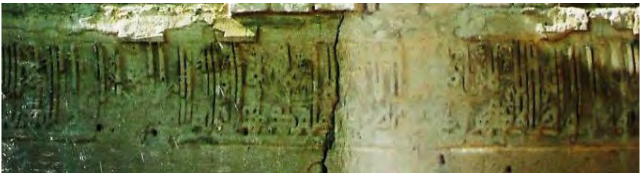
تصویر ۳. کتیبه گچی سمت راست ایوان شمالی، رباط ماهی.