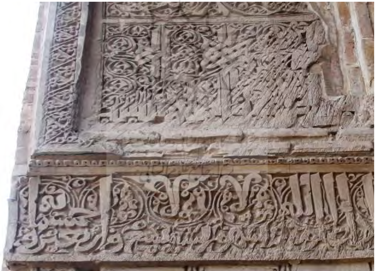
تصویر ۱۴. انتهای کتیبه‌ی ثلث ایوان سوم. و کتیبهٔ گچی بالای آن، به خط کوفی معقد، رباط شرف.