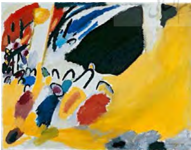
تصویر ۶. کنسرت ۱۹۱۱ م. موزه لن‌باخ هاوس در مونیخ، اثر واسیلی کاندینسکی. مأخذ: https://www.wassilykandinsky.net/year-1911.php

نمایش بگذارند. ولی در هنر اسلامی اینگونه نیست. ساختار مشخص و از پیش تبیین یافته‌ای وجود دارد، بسان قوانین مقدس، حدود و شرعیات دینی که هنرمند وفادارانه ملزم به رعایت و مراقبت آن است و هرگونه عدول از آن ناپذیرفتنی است. همین امر منجر به وجود اشتراک در آثار هنرهای اسلامی می‌شود. نقوش هندسی هنرهای سنتی تذهیب یا نقش قالی یا نقوش کاشی‌های مساجد، همه و همه از قانون تکرار الگویی مشخص پیروی می‌کنند که در قالب چهار ضلعی، پنج ضلعی و یا شش ضلعی تشکیل شده‌اند و نقوش غیرتقلیدی قابل گسترش محسوب می‌شوند. بنابراین هنرمند اسلامی در برابر ناخودآگاه خود ممتنع نیست ولی نقاش مدرن غربی به لحاظ وجوه روانی میدان عمل را به دست ناخودآگاه مهارنشده‌ی خود سپرده است. همین امر موجب می‌شود که هنرمند از پیش دقیقاً نداند که قرار است حاصل آفرینشش چه باشد؛ در جریان کار، رفته رفته اثر خود را تکمیل می‌کند. و ناخودآگاه در بی‌خودی هنرمند او را با خود می‌برد تا فرایند اثر هنری کامل شود. این امر در سایر آثار هنری نیز وجود دارد اما در هنر انتزاعی به مراتب بیشتر است. حتی در یک رمان، کلیت و پلاتی وجود دارد ولی در جریان نوشتن، شخصیت‌ها خود را پرورش می‌دهند و رفته رفته تکمیل می‌شوند. اما مثلاً یک استادکار سنتی و نگارگر از پیش دقیقاً می‌داند که قرار است براساس چه متنی، نگاره‌ای را بسازد و با چه فرایندی روبرو خواهد شد. این تفاوتی است که زیبایی‌شناسان در قرن هجدهم، بین هنر و صنعت قائل شده‌اند. و «پیر سوانه» در فصل اول کتاب خود، «مبانی زیبایی‌شناسی» به تفصیل به آن می‌پردازد: «صنعت‌گر از پیش دقیقاً می‌داند قرار است با چه روبرو