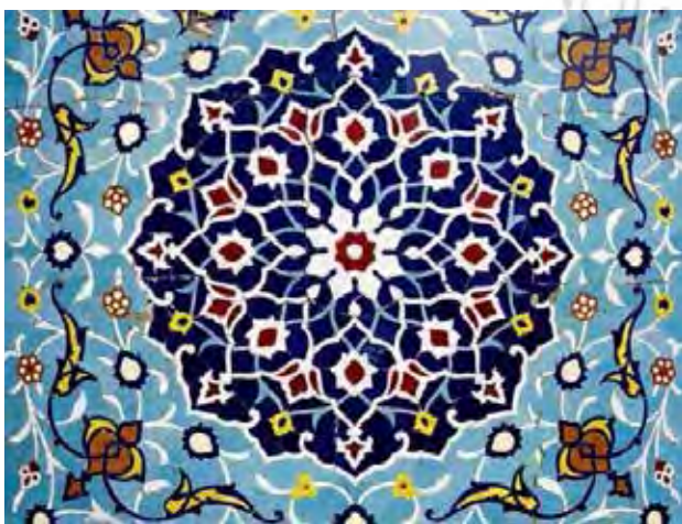
تصویر ۱. شمسه و نقوش اسلیمی، نمونه‌ای از هنر انتزاعی اسلامی، مسجد امام اصفهان.

«احدیت در عین حال که به غایت «عینی و انضمامی» است، به نظر انسان، تصویری انتزاعی می‌نماید. و این امر، به علاوه بعضی عوامل مربوط به ذهنیت سامی، مبین خصلت انتزاعی هنر اسلامی است. محور مرکزی اسلام، احدیت و وحدانیت است، ولی هیچ تصویری قادر به بیان آن نیست. مع هذا تصویرسازی در اسلام به طور مطلق منع نشده است. تصویر مستوی به عنوان هنری غیردینی به دیده اغماض نگریسته می‌شود، به شرط آنکه نه نقش خداوند باشد و نه سیمای پیامبر؛ ولی برعکس «تصویری که سایه بیفکند»،