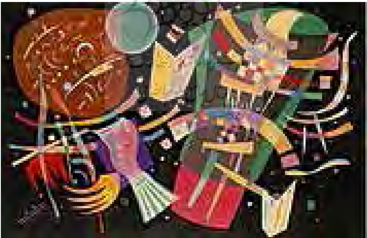
تصویر ۷. ترکیب‌بندی ۱۰، اثر واسیلی کاندینسکی.

درک و دریافت مخاطب از این آثار نیز مورد دیگری از این مطالعه است. از آنجا که این آثار از چیزی در طبیعت تقلید نمی‌کنند، دریافت مشخص و ثابتی نمی‌توان از آن داشت. یعنی می‌توانیم ادعا کنیم که نقاشی شام آخر تمام جهانیان