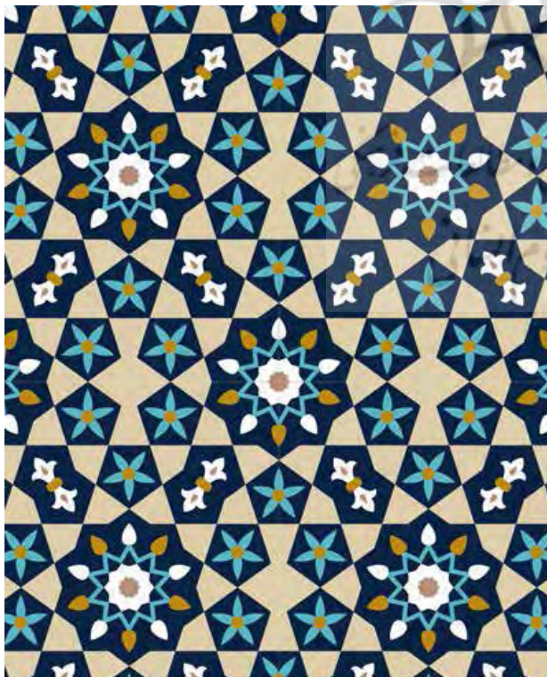
تصویر ۳. نقوش هندسی اسلامی، نمونه‌ای از هنر انتزاعی اسلامی.

استثنائاً، یعنی اگر نمایشگر حیوانی است که نقش‌پردازی شده، به تسامح پذیرفته و احتمال می‌شود، و چنین امری ممکن است در معماری قصور یا در طلاکاری [تذهیب] صورت پذیرد. به طور کلی، تصویر گیاهان و جانوران موهوم به صراحت مورد قبول قرار گرفته، اما فقط تزئینات نباتی با اشکال نقش‌پردازی شده جزء هنر مقدس محسوب شده است» (همان، ۱۳۱)؛ (تصویر ۲).