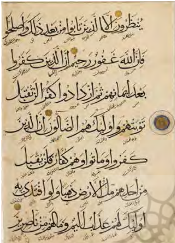
تصویر ۴. خط محقق، خوشنویسی قرآن مجید، نمونه ای از هنر انتزاعی اسلامی.

از طرفی، این که هیچ چیز، حتی به شیوه نسبی و گذران نباید میان انسان و حضور نامرئی خداوند ایجاد مانع کند» (مطهری الهامی، ۱۳۸۴، ۱۴۷).