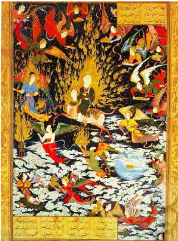
تصویر ۲. نگاره معراج حضرت محمد(ص)، اثر سلطان محمد تبریزی، نمونه‌ای از هنر انتزاعی اسلامی.