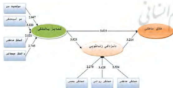
شکل ۲. تحلیل مدل مفهومی تحقیق براساس مقدار t

تحلیل مدل مفهومی تحقیق براساس مقدار t (T.VALUE) به صورت زیر است.