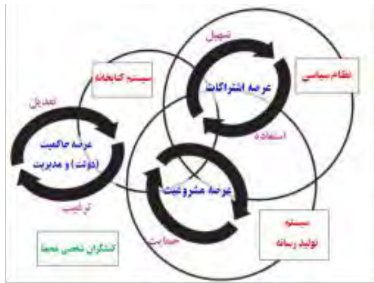
شکل ۲- عرصه‌های حوزه عمومی در کتابخانه‌های عمومی

در شکل ۲ نظام کتابخانه در محیط واقع شده است. محیط از کنشگران، نظام سیاسی و سیستم تولید رسانه تشکیل شده است. این سیستم‌ها تا حدودی با یکدیگر و نیز با کتابخانه هم‌پوشانی و تلاقی دارند. هر یک از این سه عرصه حوزه عمومی در کتابخانه‌های عمومی، با این موجودیت‌های محیطی، به شکل متفاوتی در ارتباط هستند.