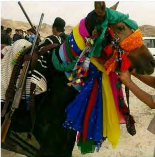
تصویر ۱. آیین کتل در مراسم سوگواری.