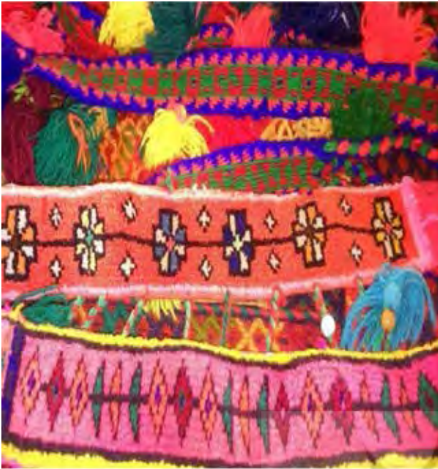
تصویر ۴. نمادهای مهرپرستی در دستبافهای زنان قوم بختیاری.

و فدیهدادن است. زنان برای باروری و یا وضع حمل آسان و دختران در طلب همسر در این چشمه‌ها شستشو کرده و به الهه باروری متوسل می‌شوند. برگزاری مراسم آیینی در کنار آب و چشمه و بقاع متبرکه در فصول برداشت محصول، همه یادگارهای دوران باستان است که شکل ظاهری آن حفظ شده اما محتوای آن تغییر کرده و با باورهای جدید همسو شده است. آیین قربانی کردن گاو نر در سال‌های خشکسالی و کم بارشی در چشمه‌های مقدس که نمادی از آیین مهری است، هنوز هم جزئی از آداب و رسوم مردم بختیاری می‌باشد. مهر، خدای بزرگ آریایی و دارنده دشت‌های فراخ و اناهیتا، الهه باروری و آب‌های پاک همواره در کنار چشمه‌ها و درختان مقدس ستایش می‌شدند و قربانیان فراوان برایشان انجام می‌شده است. • احترام به درختان