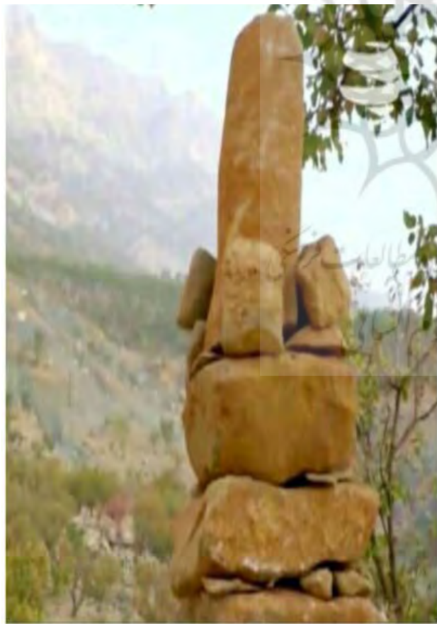
تصویر ۲. کل یا کله.

به‌طور کامل در نزدیک قبرستان خاک می‌کردند.