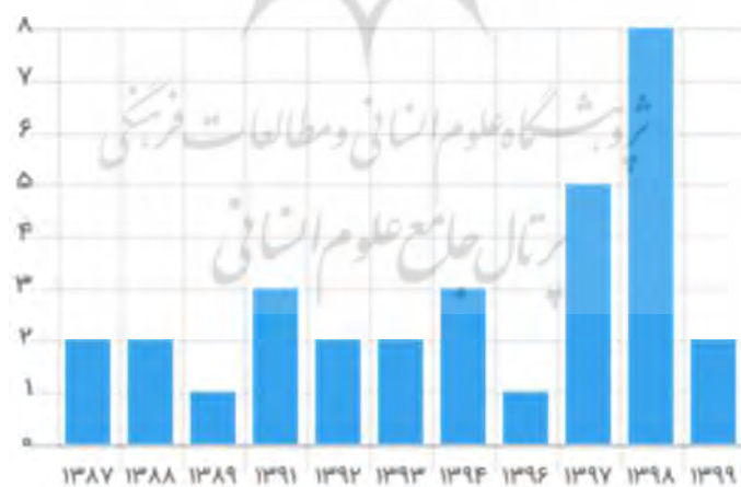
شکل (۲). تعداد پژوهش‌های دکتر محمدرسول الماسی فرد در بازه زمانی ۹۹-۱۳۸۷

نویسنده همکار این کتاب، دکتر محمدرسول الماسی فرد استادیار گروه مدیریت بازرگانی دانشکده‌ی مدیریت و حسابداری جوان رود زیرمجموعه دانشگاه رازی کرمانشاه است. براساس ارزیابی علم‌نت (جویشگر علمی فارسی)، تعداد اسناد علمی که به نام ایشان به ثبت رسیده ۳۲ اثر است که شامل ۱۶ کتاب، ۱۱ مقاله کنفرانسی، ۴ مقاله نشریه و ۱ پایان می‌باشد. در شکل (۲) تعداد پژوهش‌های ثبت شده نامبرده تا سال ۱۳۹۹ نشان داده شده است.