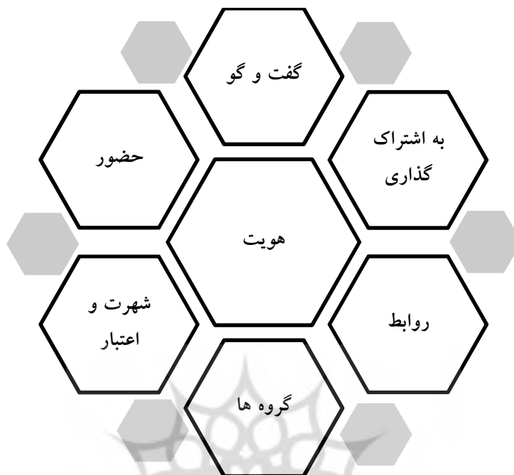
شکل ۱ عملکردهای هفتگانه رسانه‌های اجتماعی (Kietzmann & Angel, 2010)

بلوک عملکردی "هویت" حوزه و محدوده‌ای را نشان می‌دهد که کاربران تا چه میزان هویت خود را در فضای رسانه‌های اجتماعی آشکار می‌کنند. ارایه و افشای هویت کاربر اغلب می‌تواند از طریق "خود اظهاری" آگاهانه و یا ناخودآگاه اطلاعات ذهنی مانند افکار، احساسات، رغبت‌ها و نفرت‌های وی انجام شود (Kaplan & Haenlein, 2010). از آنجایی که هویت، هسته مرکزی بسیاری از سرویس‌های رسانه‌های اجتماعی است. این امر بیانگر مفاهیمی اساسی برای شرکت‌هایی است که به دنبال توسعه سایت‌های رسانه‌های اجتماعی خود یا استراتژی همراه شدن با دیگر سایت‌ها می‌باشند. بلوک "گفت‌وگو" در این چارچوب نشان می‌دهد تا چه میزان کاربران در محیط رسانه‌های اجتماعی با یکدیگر ارتباط برقرار می‌کنند. بسیاری از سایت‌های رسانه‌های اجتماعی به گونه‌ای طراحی شده‌اند که در درجه اول گفت‌وگو میان افراد و گروه‌ها را تسهیل و فراهم کنند. این گفت‌وگوها به اشکال مختلف و با دلایل گوناگون شکل می‌گیرند (Kietzmann & Angel, 2010). بلوک به "اشتراک‌گذاری" نشان دهنده مقدار محتوایی است که کاربران آن را مبادله کرده، توزیع نموده و یا دریافت می‌کنند. در میان‌گذاری و به اشتراک گذاشتن به تنهایی راه تعامل و