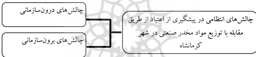
شکل ۱: مدل مفهومی و اولیه تحقیق

آشفته‌گی و ضعف همبستگی میان افراد محل و حاشیه‌نشینی، عدم دسترسی به سیستم‌های خدماتی، مشاوره‌ای و درمانی (اسلام دوست، ۱۳۸۹) و کمبود امکانات فرهنگی و ورزشی و تفریحی که زمینه ارتباطات ناسالم اجتماعی را توسعه می‌دهد (حاجلی، زکریایی و حجتی کرمانی، ۱۳۸۹). چرا که نظریه پیوند افتراقی ساترلند بر این نکته تاکید دارد که ارتباط با نزدیکان و همسالانی که بزهکار باشند، تاثیر زیادی بر تشکیل و تقویت نگرش بزهکاری می‌گذارند و فرد را به سوی بزهکاری سوق می‌دهند و انتقال فرهنگ کج‌روی از راه یک جریان ارتباطات اجتماعی حاصل می‌شود (فروع‌الدین عدل، صدرالسادات، بیگلریان و جوادی یگانه، ۱۳۸۳). بنابراین، با این رویکرد به چالش‌های انتظامی در پیشگیری از اعتیاد از طریق مقابله با توزیع کنندگان مواد مخدر پرداخته و بر اساس مبانی نظری و مطالعات پیشین، مدل مفهومی تحقیق برابر شکل ۱ ترسیم شد: