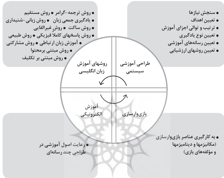
شکل ۱. ابعاد چارچوب بازی‌وارسازی آموزش زبان انگلیسی در محیط الکترونیکی با رویکرد طراحی آموزشی سیستمی