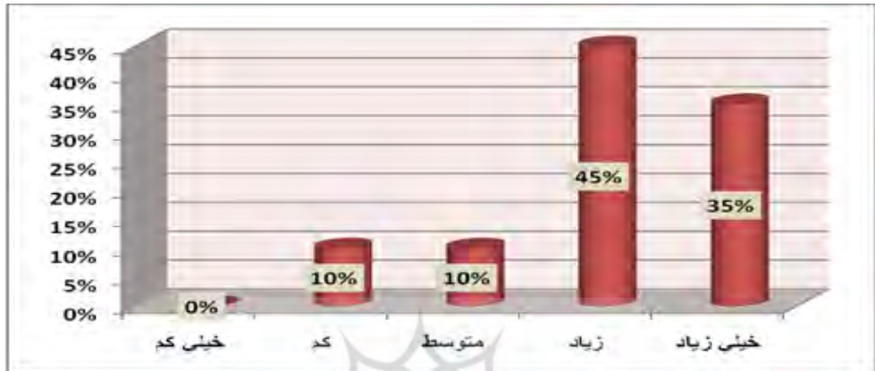
نمودار (۲) توزیع فراوانی (میانگین سؤالات مطرح‌شده در فرضیه دوم)

خیلی کم را کسی انتخاب نکرده است، بنابراین نتیجه حاصله بیان‌کننده آن است که ۷۵٪ افراد جامعه نمونه (اکثریت مطلق) معتقدند که در حوزه ارزیابی عملکرد، مؤلفه‌های ارزیابی عوامل سازمانی و فردی می‌توانند بر توانمندسازی بازرسین فنی هوانیروز در حد خیلی زیاد و زیاد تأثیرگذار باشد و فقط ۲۵٪ افراد تأثیر آن را در حد متوسط و کم دانسته‌اند.