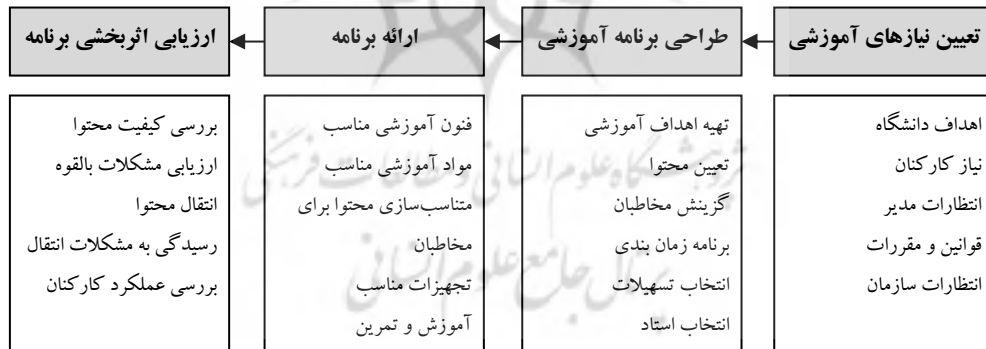
شکل ۲. مدل مفهومی پژوهش

با توجه به اینکه ارتقای اثربخشی، امری است که با رعایت ملاحظات ویژه در تک‌تک مراحل آموزش رخ می‌دهد، نه صرفاً در مرحله ارزشیابی برنامه‌های آموزشی؛ از این رو، مدل چهارمرحله‌ای آموزش براتون و گلد (محمدپور زرنندی و دیگران، ۱۳۹۶: ۱۱ - ۹) به عنوان الگوی پایه برای ساخت مدل مفهومی پژوهش حاضر مورد استفاده قرار گرفته و از محتوای الگوهای دیگر برای تبیین مؤلفه‌های هر مرحله از آموزش استفاده شده است (شکل ۲). در این الگوی نظام‌مند، نیازهای آموزشی کارکنان سازمان براساس نیازسنجی‌هایی شناسایی و تحلیل می‌شوند، سپس اهداف رفتاری خاص و روشن تعیین می‌گردند تا در طراحی رویدادها و برنامه‌های آموزشی و ارزشیابی نتایج این آموزش‌ها به کار روند (محمدپور زرنندی و دیگران، ۱۳۹۶).