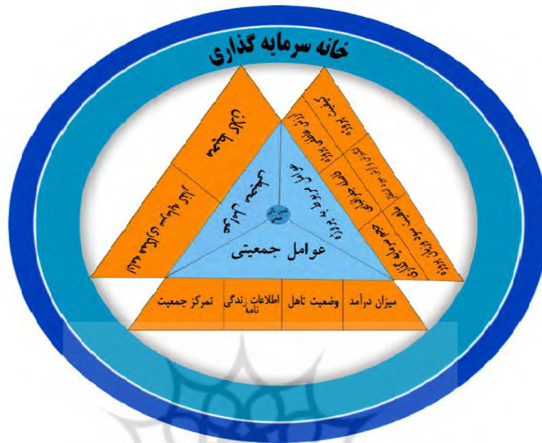
مدل ۱. عوامل تأثیرگذار بر موفقیت رفتار تأمین مالی جمعی