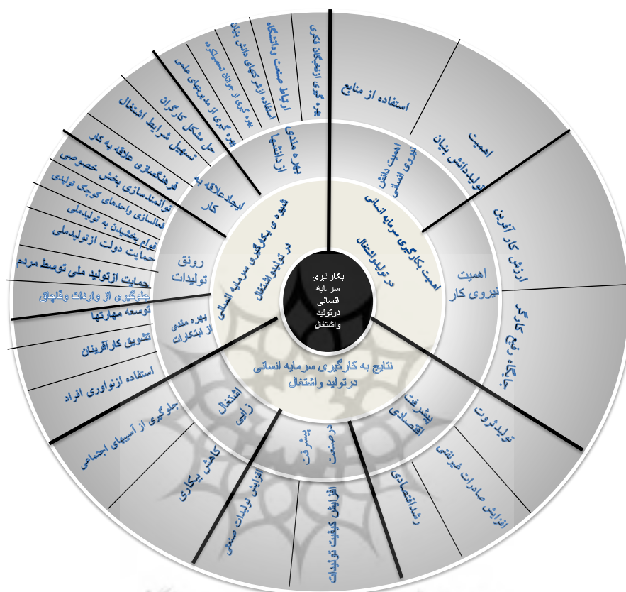
شکل (۳): مدل جایگاه سرمایه انسانی در تولید و اشتغال از دیدگاه مقام معظم رهبری

با توجه به مؤلفه‌های استخراج‌شده شکل (۳) طراحی گردید.