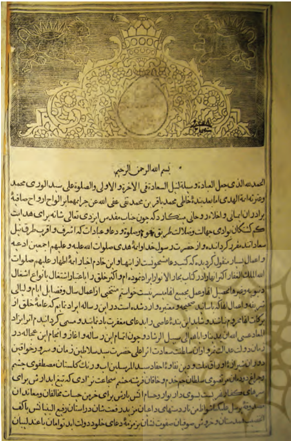
تصویر ۲. صفحه آغازین کتاب زادالمعاد چاپ سربی علامه مجلسی منتشره به سال ۱۲۴۴ق. در تهران

(جدول شماره ۲) و در طول دوره قاجار نیز به مدد صنعت چاپ به دفعات در تهران، تبریز، اصفهان، شیراز و... به شیوه چاپ سربی و چاپ سنگی منتشر شده است. و طبق آمار اولیه‌ای که استحصال گردیده این کتاب در طول دوره قاجار بیش از ۷۰ بار چاپ و انتشار یافته و اگر متوسط تیراژ این کتاب ارزشمند را ۵۰۰ نسخه در نظر بگیریم این کتاب در این بازه زمانی بیش از ۳۵۰۰۰ نسخه چاپ شده است ۱۱ و بی‌شک می‌توان آنرا به عنوان پرچاپ‌ترین کتاب دعا در دوره قاجار نام برد.