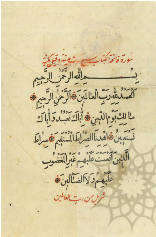
تصویر ۱: اولین قرآن چاپ سربی منتشره به سال ۱۲۴۲ق. در تهران

حفظ آرامش جامعه بدون گرفتن مجوز از مفتی، به چاپ کتاب اقدام نکنند. ۸ در همین جاست که ابراهیم متفرقه اقدام به نگارش رساله‌ای با نام «وسيلة الطباعة» نموده که در آن به مزایا و فواید صنعت چاپ می‌پردازد. ابراهیم متفرقه استفتائی زیرکانه به همراه این رساله برای مفتیان و قضات ارسال نموده و طی این استفتاء از آنها می‌خواهد که نظر خود را در خصوص راه اندازی این چاپخانه اعلام نمایند. متن استفتاء این بود: