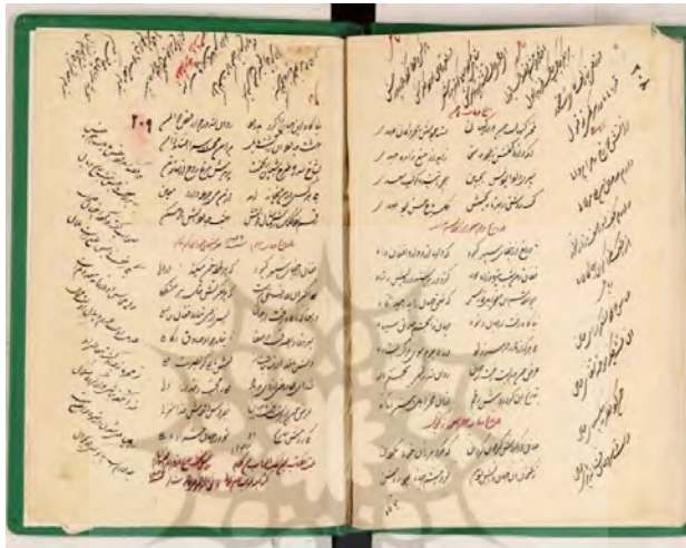
شکل ۲- بیت انجام دیوان.

تمت الكتاب بعون الملك الوهاب من كلام روشن کتبت بتاريخ یازدهم شهر ذیقعدہ الحرام کتبه العبد المذنب لاثم لعالی الوثائق بالله المتوکل علی الله، شاکر سنه ۱۲۸۲. (برگ: ۲۰۹ ن خ)