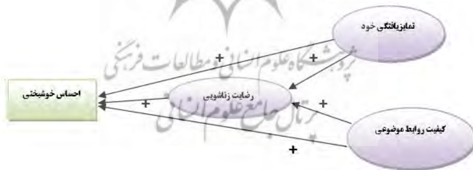
شکل ۱. مدل پیشنهادی رابطه علی تمایز یافتگی خود و کیفیت روابط موضوعی با احساس خوشبختی با میانجی‌گری رضایت زناشویی مذهبی