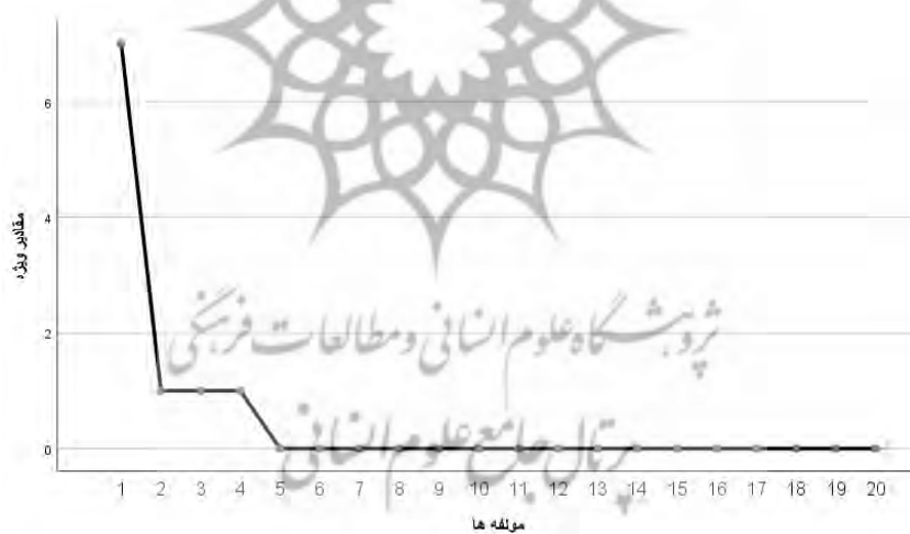
شکل ۱. نمودار اسکری کتل مؤلفه‌های استخراجی پرسشنامه خودکارآمدی پدر

همچنان که از جدول ۱ برمی‌آید در پژوهش حاضر مقدار KMO برابر ۰/۹۱ است که نشانگر کفایت نمونه انتخاب شده است؛ همچنین آزمون کرویت بارتلت برابر ۲۷۳۲/۱ است که در سطح P < ۰/۰۵ معنادار است که نشان می‌دهد همبستگی داده‌ها در جامعه صفر نیست. در این تحلیل با استفاده از چرخش واریماکس چهار عامل که دارای مقادیر ویژه بالاتر از یک بودند و مواد آن‌ها بار عاملی بالاتر از ۰/۳ داشتند به دست آمد.