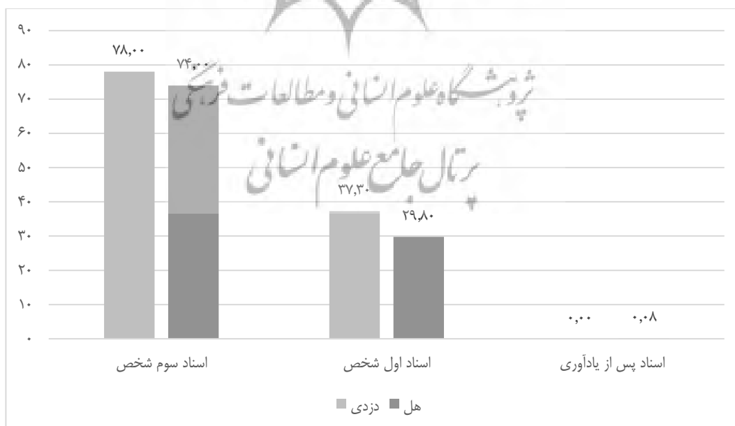
شکل ۲. مقایسه میزان اسناد شادی در سه اسناد اول شخص، سوم شخص و پس از یادآوری در دو داستان

نتایج مصاحبه ها برای هر سه پرسش بر مبنای اسناد شادی در شکل ۲ آمده است که بر اساس آن، اسناد شادی، در وضعیت سوم شخص، بیشترین استناد و در اسناد شادی پس از یادآوری، کمترین اسناد را داشته است.