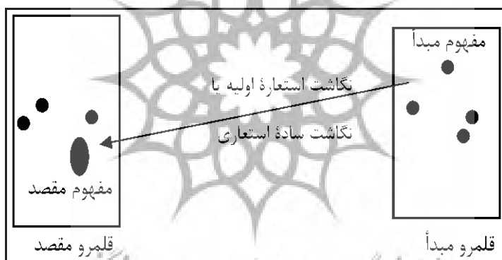
شکل ۱. نگاشت ساده استعاری (یوانز و گرین، ۲۰۰۶، ص ۳۰۸؛ به نقل از هاشمی، ۱۳۸۹)

همچون تشبیه، استعاره و...، آن‌ها را تصورات استعاری ۱ دانسته‌اند. تصورات استعاری تصوراتی هستند که انسان‌ها به کمک آن‌ها به تفکرات و تجارب خود برحسب تصورات مشخص دیگری نظم می‌دهند. از نظر آن‌ها عصاره و چکیده استعاره [و دیگر تعبیرات استعاری]، همان درک و تجربه مفهومی برحسب مفهومی دیگر است. به بیان دیگر برخلاف سنت ارسطویی که تعبیرات استعاری را تنها آرایه زبان تلقی می‌کند و نه عامل سازنده آن، لیکاف و جانسون برای نخستین بار نوعی تحلیل شناختی از استعاره را ارائه کردند که «نظریه مفهومی در باب استعاره ۲ » یا «نظریه استعاره مفهومی» نام گرفته است. استعاره مفهومی دراصل، فهم و تجربه چیزی در اصطلاحات و عبارات چیز دیگر است. اساس این رابطه که به شکل تناظرهای میان دو مجموعه صورت می‌گیرد، «نگاشت ۳ » نامیده شده است. آن‌ها مجموعه‌ای را که دارای مفهومی عینی‌تر و متعارف‌تر است، قلمرو مبدأ، دهنده یا منبع ۴ (قلمرویی که نگاشت می‌شود) و مجموعه دیگر را که دارای مفاهیم انتزاعی و ذهنی‌تر است، قلمرو مقصد، گیرنده یا هدف ۵ (قلمرویی که نگاشت بر آن صورت می‌گیرد) خوانده‌اند (شکل شماره ۱).