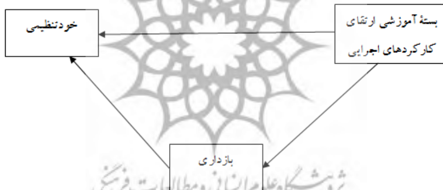
شکل ۱. مدل مفهومی تاثیر بسته آموزشی ارتقای کارکردهای اجرایی در ارتقای خودتنظیمی با تاکید بر نقش واسطه‌ای بازداری

سازه بازداری به عنوان یک متغیر واسطه‌ای تاکید کردند زیرا که بازداری افراد را قادر می‌ساخت تا تاثیر افکار و اعمال ناخواسته را محدود سازند و به سمت اهداف مدنظرشان پیشروی کنند (اندرسون و ویور ۱ ، ۲۰۰۹). در این رابطه گفته می‌شود اگرچه در بسیاری از موارد دانش آموزان از سطح بازداری مناسبی برخوردار هستند با این حال در برخی موارد تعدادی از دانش آموزان در این زمینه دچار اشکال می‌شوند؛ به گونه ای که ایراد آنها در بازداری خود را در قالب عدم واکنش مناسب در رویدادهای اجتماعی ناآشنا، ابرازهای هیجانی افراطی، خجالتی بودن، اجتناب اجتماعی و بیش فعالی فیزیولوژیکی نشان می‌دهد (دیتون و تروی ۲ ، ۲۰۰۵). از آنجایی که برنامه آموزشی کارکردهای اجرایی شامل آموزش‌های مستقیم بازداری است بنظر می‌رسد که این سازه بتواند در رابطه بین آموزش کارکردهای اجرایی و خودتنظیمی نقش واسطه‌ای ایفا کند (هافمن، اسپچمیچل و بادلی ۳ ، ۲۰۱۲؛ میکایی و فریدمن ۴ ، ۲۰۱۲). در مجموع و با توجه به مطالب گفته شده مدل مفهومی پژوهش به منظور برازش و آزمون فرضیه‌ها به صورت زیر ارائه می‌گردد: