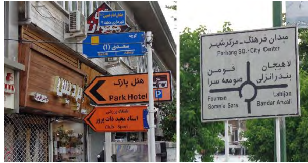
شکل ۲. عدم دقت در نصب تابلو و بی نظمی حضور نوشتار از کارکرد حسی نوشتار می‌کاهد و اغتشاش بصری ایجاد می‌کند