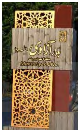
شکل ۴. حس تغزلی و ایرانی خط نستعلیق مقایسه شود با فونت ترافیک در تابلوی ایستگاه تاکسی