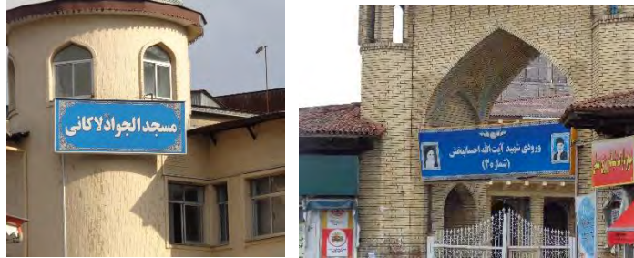
شکل ۱۳. عدم هماهنگی تابلو و زمینه معماری در فضای شهری (نگارنده)

تدوین قواعد و قوانین کنترل کننده کیفیت نوشتار در شهر، بستر ایجاد معنای حسی نوشتار با توجه به مؤلفه‌های هماهنگی و تضاد را در شهرداری آینده فراهم می‌کند.