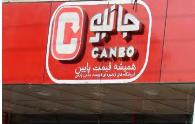
شکل ۵. معنای حسی نوشتار برند معروف جانبو، القای حس تمرکز بصری و قدرت، از طریق اندازه، طراحی فونت و رنگ سازمانی

جایگاه، یک رخداد، یک کمپانی و محصولاتش را شرح می‌دهند. این مؤلفه‌ها بر شکل‌گیری حس مکان تأثیرگذار است (کالوری و واندن ایندن، ۲۰۱۵، ۶-۹). طراحی نوشتار و توجه به معنای حسی آن در فضای شهری زمینه بهتر دیده شدن و ماندگاری تصویر برندها را در ذهن مخاطب فراهم می‌کند و این مؤلفه بر مسیریابی، مکان‌سازی و شکل‌گیری اطلاعات تفسیری در ذهن مخاطب مؤثر است.