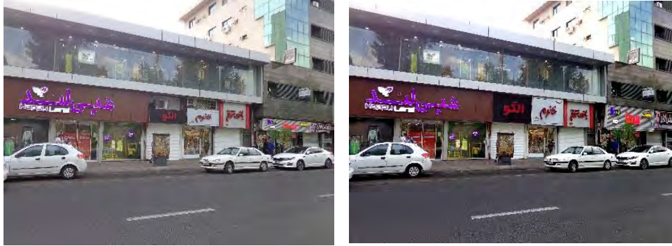
شکل ۱۲. چپ عرض و عمق نامنظم تابلوهای فروشگاه‌های را نشان می‌دهد. تصویر راست ایجاد نظم از طریق کنترل ارتفاع، عمق و عرض تابلوهای فروشگاه‌ها را نشان می‌دهد.