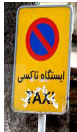
شکل ۳. نمونه‌ای از برهم نویسی نوشتار بی نظمی در تابلوی ایستگاه تاکسی