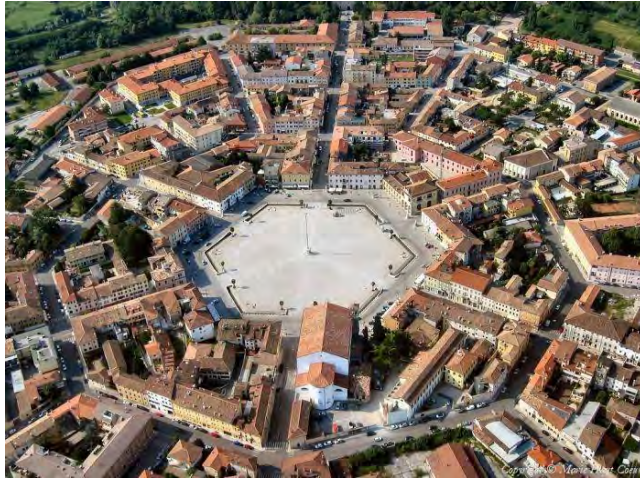
شکل ۱. شهر باستانی پالمانوا فضای کالبدی شهر نشان از درهم تنیدگی فضای عمومی و خصوصی است که انسان می تواند تمام اجزای شهر را با حواس ۵ گانه خود حس کند.