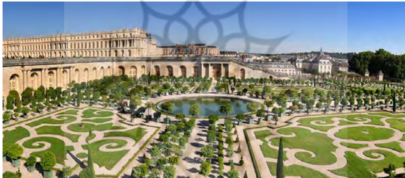
شکل ۲. نمایی از کاخ ورسای که خود را در معرض نمایش شهروند قرار می دهد. در این مجموعه شهری به تناسبات انسان توجه شده است.