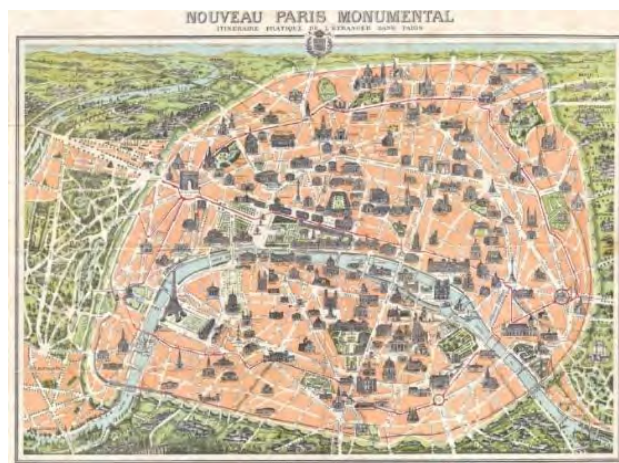
شکل ۳. پاریس در دهه ۱۹۰۰ میلادی در این شهر مفهوم سلسله مراتب، حومه و حریم کم رنگ می‌شود و سرعت برای شهر بسیار مهم تلقی می‌شود.