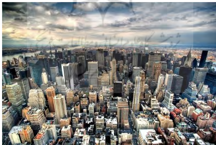
شکل ۴. کلانشهر نیویورک اکنون از گره‌ها و شریان‌های آمد و شد سریع است. شهری با پراکندگی بسیار کم مرکز و پیرامون در آن بی‌معنی شده است. در این شهر فرهنگ غالبی وجود ندارد. نیویورک شهری با دگرگونی‌های چشمگیر فنی است که به سرعت در حال طی کردن سیر شبکه‌ای شدن است.

«در سه دههٔ آخرین قرن بیستم، مفهوم کلان‌شهر در حیطهٔ دگرگونی‌های چشمگیر فنی در وسایل و شبکه‌های حمل‌ونقل، بخصوص ریلی، جاده‌ای، و هوایی و نیز شبکه‌های ارتباطی دگرگون می‌شود. شهری که این زیست‌جهان‌های متفاوت را به وسیلهٔ شبکه‌های جاده‌ای و ریلی سریع‌السیر و شبکه‌های ارتباطات از راه دور به هم می‌دوزد. مکان‌هایی با نقش‌های دوگانهٔ واقعی و مجازی که در آن‌ها مفاهیم زمان، مکان، و فاصله دگرپرسی یافته‌اند. عبور از کلان‌شهر (متروپل) به وراشهر (متاپول ۲ ) در حال وقوع است. در متاپول جهان‌های موازی در کنار هم قرار گرفته‌اند و با یکدیگر ارتباط برقرار می‌کنند. منطقه‌های از نظر عملکردی پیوسته و از نظر اجتماعی ناپیوسته، متمرکز و نامتمرکز، گسسته ولی متعامل با پیراشهرهای در هم آمیخته است و روابط چهره به چهره و رودررو اهمیتی دوچندان می‌یابند» (حبیبی، ۱۳۹۴).