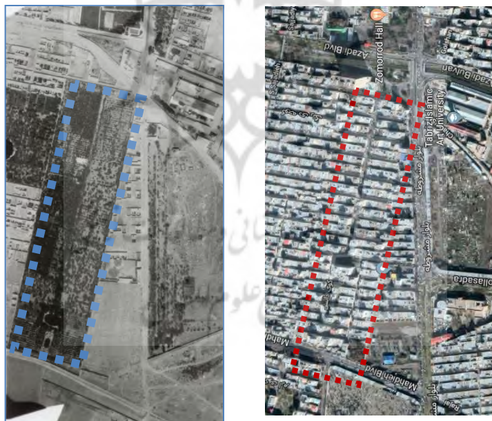
شکل ۱- سمت راست: موقعیت کوی دانش در سال ۱۳۹۷، سمت چپ: موقعیت زمین خالی در سال ۱۳۴۶ قبل از اختصاص یافتن به کوی دانش