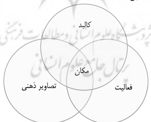
شکل ۱- مدل مفهومی مکان و اجزای آن

مدل دیوید کانتر ۲ (۱۹۷۷)، یکی از چارچوب‌های نظری کارآمد که قادر به تبیین مؤلفه‌های مکان است، محسوب می‌شود. بر اساس مدل مزبور، که به مدل مکان شهرت دارد محیط شهری به‌مثابه مکان متشکل از سه بعد و مؤلفه درهم‌تنیده کالبد (فرم)، فعالیت و تصورات ذهنی است. مؤلفه کالبدی - فضایی یا فرم که بیانگر خصوصیات فیزیکی مکان؛ مؤلفه جمعی - رفتاری که بیانگر رفتار و فعالیت‌های انسانی حادث در فضا و مؤلفه ادراکی - دریافتی که بیانگر مفاهیم و توصیفات کاربران مکان می‌باشد. این مفاهیم از یک سو بر اساس اطلاعات دریافتی از محیط شکل می‌گیرند و از سوی دیگر مبنای عمل هر فرد در مکان می‌شوند. بدین لحاظ، مکان از سه سامانه و مؤلفه مرتبط به هم (شکل ۱) که بدان معنا و مفهوم خاص می‌بخشند تشکیل شده است.