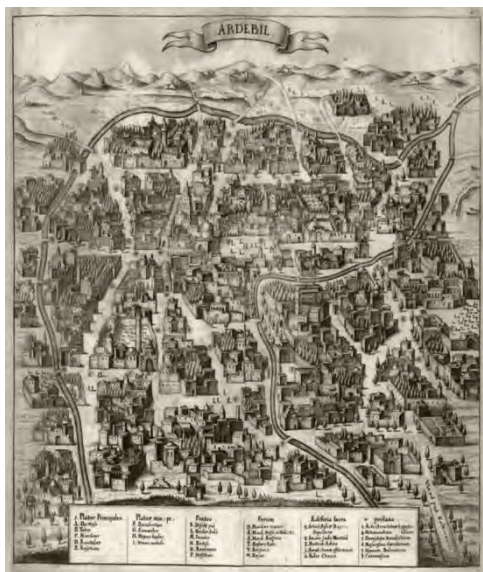
شکل ۲- اردبیل صفوی (۱۶۳۷م) ترسیم دستی از آدام اولناریوس