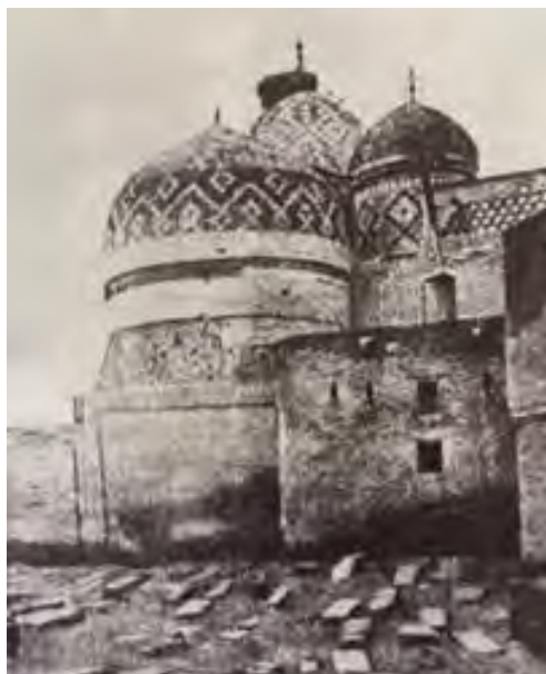
شکل ۳- بقعه شیخ صفی‌الدین ۱۸۹۷