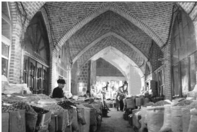
شکل ۴ - نمای داخلی بازار اردبیل

این بازار از شاخص فرهنگی همچون درون‌گرایی برخوردار بوده که فرد را به درون خود می‌کشاند و در ساختار آن از بیهودگی و اتلاف پرهیز شده است (رجبی، ۱۳۸۶، ۱۷۴). بازار اردبیل نیز از شاخصه‌های فرهنگی تبعیت کرده است.