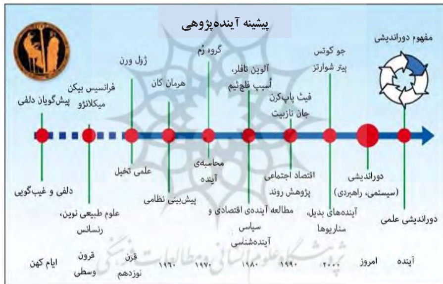
شکل ۱. سیر توسعه آینده پژوهی

شاید بتوان ریشه آینده پژوهی را در ۲۰۰۰ سال پیش از میلاد مسیح جستجو کرد. در دوران معاصر و در سال ۱۹۴۶ میلادی، نخستین تلاش ها برای آینده پژوهی روش مند با پیش بینی های مؤسسه پژوهشی استنفورد ۱ شکل گرفت. پس از آن هرمان کان مبدع روش سناریونویسی، در مؤسسه رند ۲ سال ۱۹۴۸ به آینده پژوهی روش مند اقدام کرد.