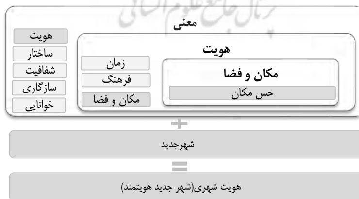
شکل ۱- دیاگرام مفهومی جایگاه هویت در ادبیات پژوهش

یکی از مسائل بنیادین در شناخت و درک نقش محیط ساخته شده در زندگی مردم و نیز کسب توانایی در طراحی و دگرگونی آن در راستای ایجاد تأثیرات مثبت، فهم چپستی معنای محیط است. بنابراین هر تعریف، توصیف یا تبیین ماهیت کارکرد محیط باید با توجه به چیزی در فضای اطراف ما باشد، زیرا فضای اطراف ما اصلی‌ترین معیار تعریف محیط است (کاوش‌نیا و همکاران، ۱۳۹۶: ۱۵۴). لذا شهر نیز به عنوان فضای اطراف ما خود دارای مجموعه وسیعی از عناصر و مفاهیم متکثر و متنوعی است، که فهم آنان گام اول شناخت و ایجاد یک شهر خواهد بود. در این راستا با بهره‌گیری از تعریف لینچ ۱ در کتاب شکل خوب شهر و بنابر همپوشی با موضوع پژوهش که تأکید آن بر عنصر معنایی بیشتر است، هویت و مفاهیم وابسته و پیوسته با آن به عنوان زیر مجموعه سنجه معنی از میان هفت ارزش یا معیاری که لینچ برای شکل خوب شهر برشمرده است نظیر: سرزندگی، معنی، تناسب، دسترسی، نظارت و اختیار، کارایی و عدالت، مورد مطالعه قرار می‌گیرد (Lynch, 1981) (شکل ۱).