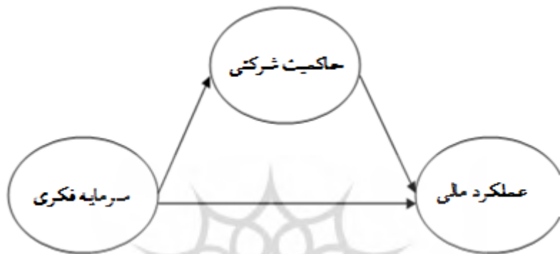
شکل ۱. مدل مفهومی تحقیق: جوآن وهمکاران (۲۰۲۱)