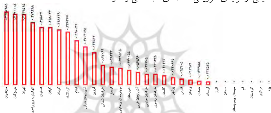
نمودار (۲): ناکارایی سراسری استان‌های ایران در دوره ۱۳۹۴-۱۳۹۸

به منظور بررسی میزان ناکارایی سراسری حاصل از برآورد انجام شده، مقدار متوسط کارایی به دست آمده در مدل‌های ۶ و ۷ محاسبه و از عدد یک (به عنوان حداکثر کارایی) کم شد. مقدار حاصله به نوعی نشانگر میزان ناکارایی سراسری استان‌های ایران است، نمودار (۲) نشان‌دهنده میزان ناکارایی سراسری استان‌های ایران است، با توجه به نتایج، استان‌های یزد، مرکزی، کردستان، قم، سیستان و بلوچستان، سمنان، البرز با توجه به ورودی‌ها و خروجی‌های سیستم، دارای کارایی سراسری بوده‌اند و بالاترین سطوح ناکارایی مربوط به استان مازندران است. پس از مازندران استان‌های هرمزگان، تهران، کهگیلویه و بویراحمد، اصفهان، گیلان و کرمان بالاترین سطوح ناکارایی سراسری شامل تجمیعی از تولیدی، توزیعی، اقتصادی، اجتماعی را دارا هستند.