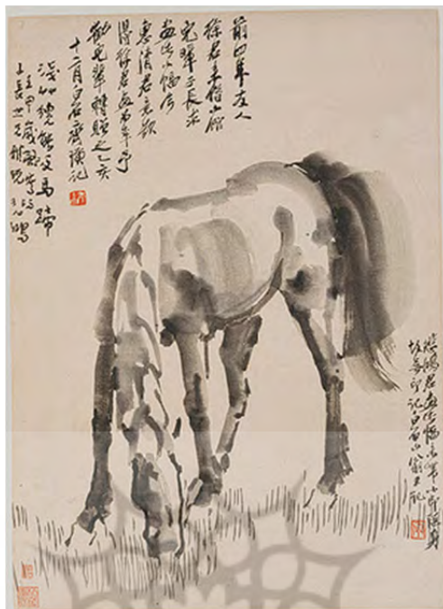
تصویر ۳. چرای اسب، مورخ ۱۹۳۲ ژو بیهونگ (چینی، ۱۸۹۵-۱۹۵۳) مرکب بر روی کاغذ 20 1/2 x 14 3/4 in. (52.1 x 37.5 cm) ( http://www.metmuseum.org/toah/works-of-art/1986.267.192 )