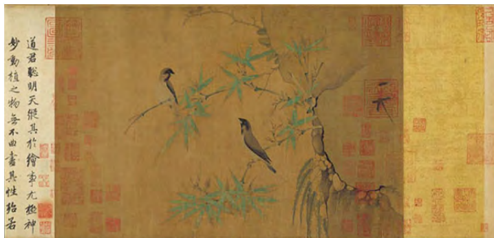
تصویر ۱. فنج‌ها و بامبو، سلسله شمالی سانگ (۹۶۰-۱۱۲۷) امپراتور هویزونگ مرکب و رنگ بر روی ابریشم (۲۷.۹ X ۴۵.۷ سانتی متر) حک شده با رمز امپراتور

http://www.metmuseum.org/toah/works-of-art/1981.278