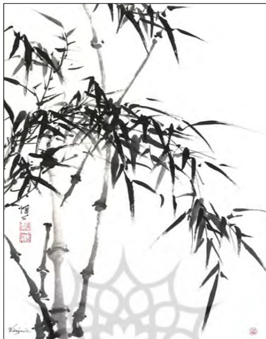
تصویر ۷. بامبوی مرکبی سیاه ویرجینیا لوید دیویس 17" 17" w x 27" h

( http://joyfulbrush.com/gallery1_bamboo/2blackinkbamboo2.html )