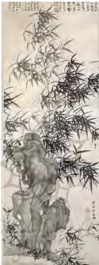
تصویر ۶- بامبو در باد، سلسله مینگ، CA. ۱۴۶۰