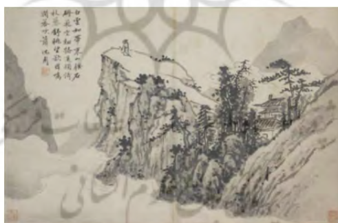
تصویر ۴. شن ژو، شاعری ایستاده بر قله کوه، قرن پانزدهم، http://www.chinaonlinemuseum.com/painting-shen-zhou-poe-on-a-mountaintop.php