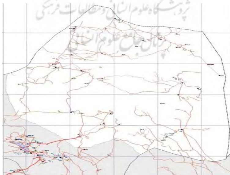
شکل ۲. موقعیت جغرافیایی روستاهای کوهستانی کوهسار در شهرستان حاجی‌آباد هرمزگان به تفکیک روستاها؛