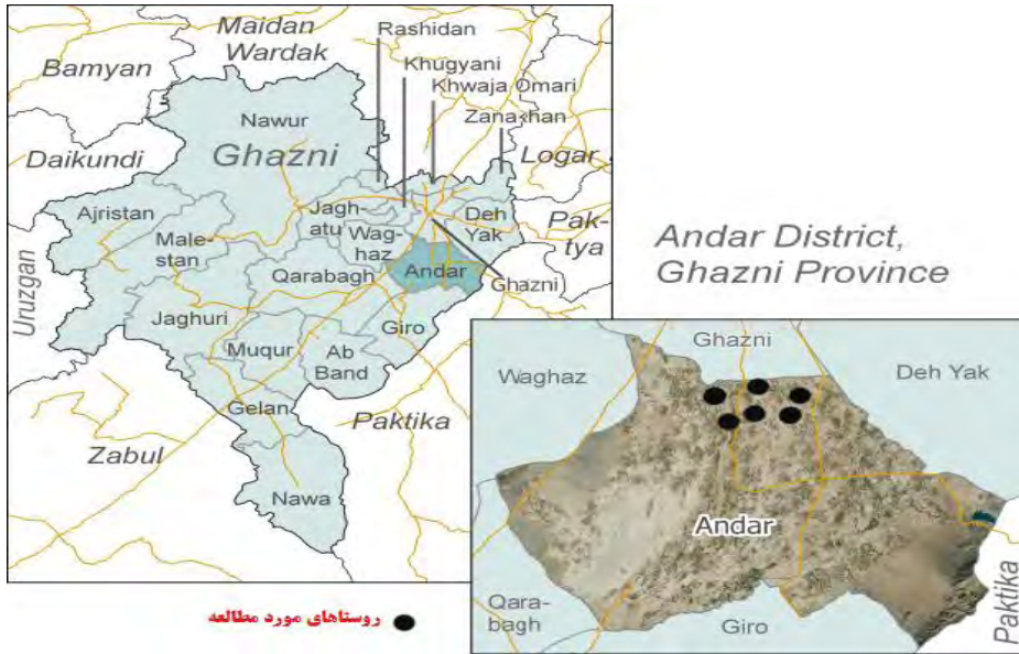
شکل ۱. موقعیت جغرافیایی محدوده مورد مطالعه در کشور افغانستان، استان غزنی، شهرستان اندر