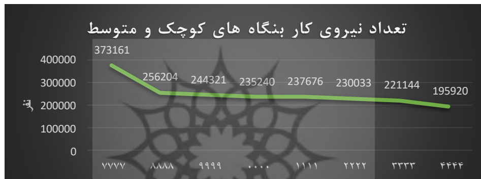
شکل ۲. نمودار تعداد نیروی کار بنگاه‌های کوچک و متوسط

افزایش نسبت به سال ماقبل خود فعالیت نموده است. همان‌گونه که در شکل (۲) نشان داده شده است تعداد نیروی کار در سال ۱۳۸۷، ۲۷۳،۱۶۱ نفر بوده است که این تعداد در پایان سال ۱۳۹۴ به عدد ۱۹۵،۹۲۰ نفر رسیده است که این به معنای فعالیت حدود ۷۲ درصد از آنان در سال ۱۳۹۴ می‌باشد. این روند از یک طرف روند کاهشی تولید در بنگاه‌های کوچک و متوسط را نشان می‌دهد و از طرف دیگر بیان‌گر تأثیرپذیری زیاد این بخش از نوسانات اقتصادی می‌باشد که با افزایش سطح تحریم‌ها و روند صعودی نرخ ارز و به تبع آن تورم و عملاً عرصه فعالیت بر این بنگاه‌ها تنگ شده و موقعیت فعالیت خود را از دست می‌دهند. به عبارت دیگر بنگاه‌های کوچک و متوسط با نرخ تورم افزایشی طی این سال‌ها عملاً توان مقابله با افزایش قیمت را نداشته و به دلیل پشتوانه ضعیف آن‌ها کم‌کم از گردونه تولید خارج می‌شوند و بنگاه‌ها به تعدیل نیروهای خود می‌پردازند.