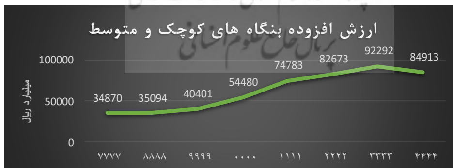
شکل ۱. نمودار ارزش افزوده بنگاه‌های کوچک و متوسط

ارزش افزوده کسب و کارهای کوچک و متوسط همانطور که در شکل (۱) ملاحظه می‌شود دارای روند صعودی از سال ۱۳۸۷ تا سال ۱۳۹۳ می‌باشد و تنها در سال ۱۳۹۴ به دلیل نرخ تورم و سایر نوسانات بازار کالا کاهش یافته است. به بیان دیگر می‌توان این گونه گفت که در تمامی سال‌های مورد بررسی روند ارزش افزوده، روندی صعودی بوده و تنها در سال آخر به دلیل تضعیف توان بنگاه‌های کوچک و متوسط دارای ارزش افزوده کاهشی بوده‌اند. ارزش افزوده در سال ۱۳۸۷ با رقم ۳۴,۸۷۰ میلیارد ریال شروع و تا سال ۱۳۹۳ حدود سه برابر و به رقم ۹۲,۲۹۲ میلیارد ریال رسیده است و با کاهش در سال ۱۳۹۴ به رقم ۸۴,۹۱۳ میلیارد ریال رسیده است.