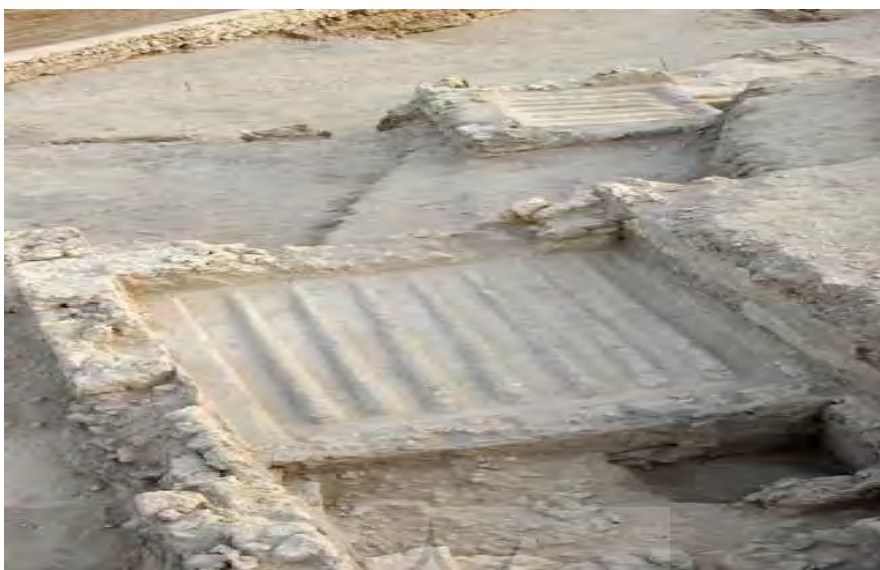
تصویر ۳. معماری استحصال شیرۀ خرما، یافته شده در قلعه بحرین (Lombard, 2005: 17)