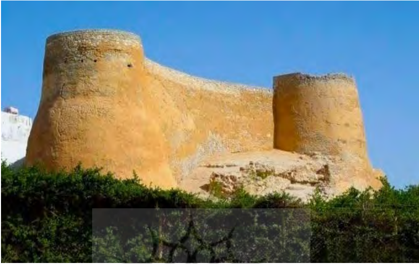
تصویر ۱. قلعه تاروت که در جزیره تاروت و شرق قطیف قرار داشت. این قلعه توسط عیونی‌ها احداث و توسط پرتغالی‌ها تجدید بنا شد (الدوره، ۲۰۰۱: ۱۶۲)