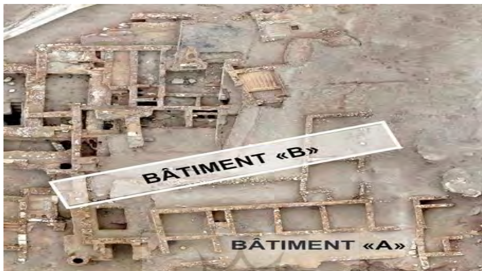
تصویر ۵. قسمت A: بخش بازار یا کاروانسرا؛ قسمت B: بخش‌های دیگر قلعه بحرین ( Lombard, 2005: 37)