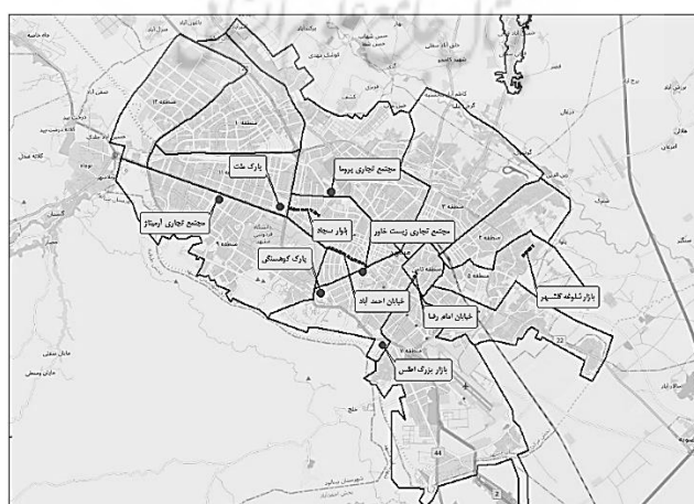
نقشه ۱- موقعیت عرصه‌های همگانی منتخب در شهر مشهد مقدس

در ادامه، به‌منظور بررسی روایی و اعتبار محتوایی مقوله‌های مؤثر بر کیفیت عرصه‌های همگانی شهری، ابتدا ۱۰ عرصه همگانی که بیش‌تر موردتوجه شهروندان مشهد مقدس بودند، به کمک پرسشنامه الکترونیکی، انتخاب گردید. این عرصه‌ها عبارتند از: پارک ملت، پارک