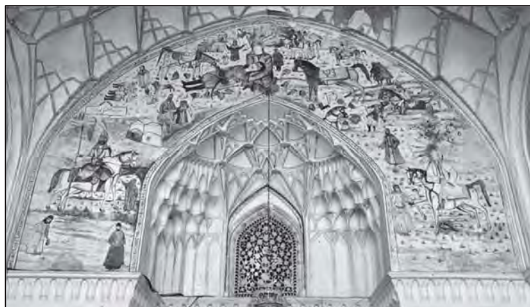
شکل ۱. دیوارنگاره بالای سردر ورودی امامزاده محمد اوسط علیه السلام

موضوع مذهبی، روستای جوشقان استرک، شهرستان کاشان، اصفهان. ۱