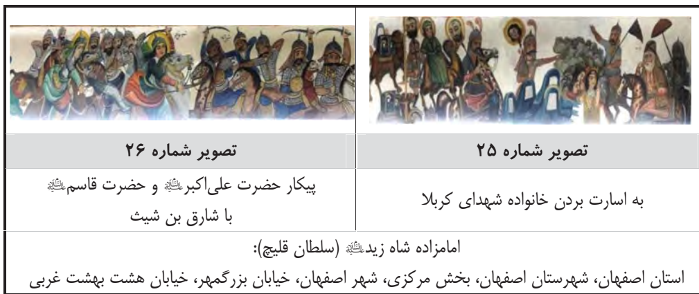
جدول ۳. مؤلفه‌های اصلی زیباشناسی دیوارنگاره‌های بقاع متبرکه عصر قاجار در اصفهان ۱