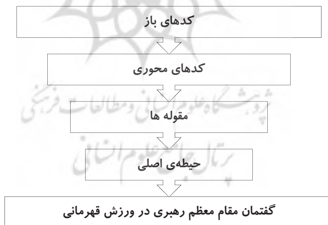
شکل (۱) ظهور حیطه اصلی بر خواسته از تحقیق

همان‌طور که در شکل (۱) مشاهده می‌کنید از تمام مفاهیم استنباط‌شده تحقیق، یک حیطه اصلی با عنوان گفتمان مقام معظم رهبری در ورزش قهرمانی استخراج گردید. این مهم نمایانگر آن است که تمام مفاهیم (کدهای باز، محوری و مقوله‌ها) ذیل این حیطه اصلی قرار می‌گیرند: