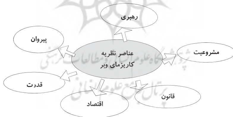
نمودار شماره ۱: مؤلفه‌های نظریه کاریزماتیک وبر

کاریزما سیادت کاریزمایی نوع مشخصی از ساخت اجتماعی بوده و دارای ارگان‌های شخصی و سازمانی برای انجام خدمات و تهیه حوائج می‌باشد، نیروهای شخصی کاریزما مطابق با اصل وفاداری مرید به مرشد و بنا به ضوابط کاریزمایی برگزیده می‌شوند. و - نه قانون - این افراد از میان خیل پیروان گروه نزدیک به کاریزما را تشکیل می‌دهند. (وبر، ۱۳۷۴: ۴۴۰) مریدان - پیروان - افرادی تنگ‌نظر، متعصب و یک‌سو‌نگرند و بدون چون‌وچرا از رهبر فرمانبرداری می‌کنند و جان خود را در راه او فدا می‌نمایند. (وبر، ۱۳۷۴: ۴۰۲)