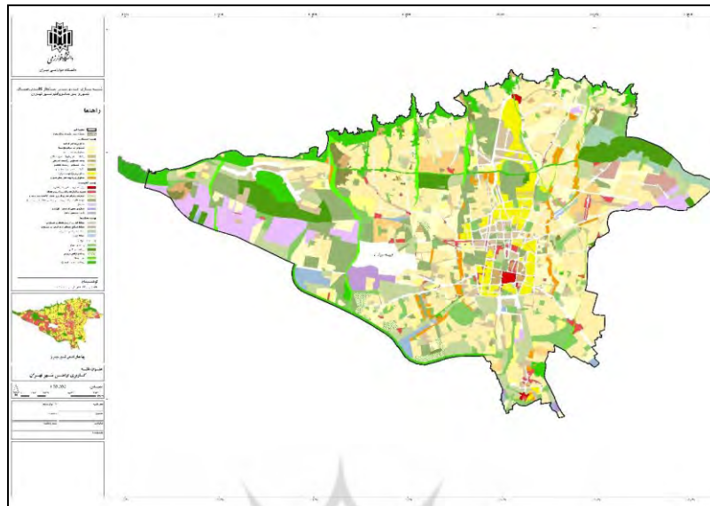
شکل (۱). موقعیت جغرافیایی منطقه مورد مطالعه