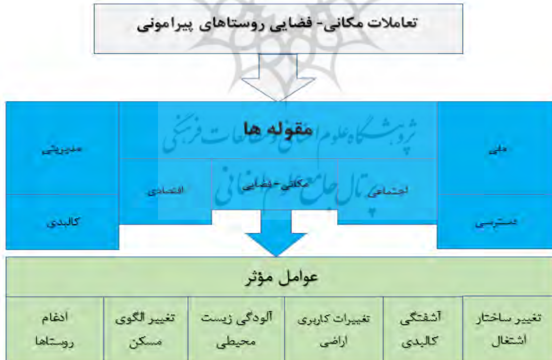
شکل ۱: مدل مفهومی تحقیق.

کوچک)، همچنین بین حوزه های شهری و روستایی به سرعت افزایش یافته است. با توجه به دیدگاه اقتصاد سیاسی فضا، شهرهای بزرگ کشورهای در حال توسعه در مقایسه با دیگر مناطق یک کشور از امکانات بیشتری برخوردارند و بخش اعظم منابع و قدرت را در خود جمع کرده اند. از طرفی هم در اینگونه کشورها، غالباً قدرت سیاسی و اقتصادی با هم در آمیخته و در مناطق نسبتاً پیشرو متمرکز شده است و باعث تشدید نابرابری در سطوح ملی، ناحیه ای و محلی می شوند به عبارتی قطبهای قدرت سیاسی، قطبهای سرمایه و قدرت اقتصادی نیز هستند که محل آن بزرگترین شهر ناحیه و کشور می باشد، عوامل اقتصادی مانند نیروهای بازاری و واکنش دولت در برابر بازار از عوامل موثر در گسترش فیزیکی شهرها است (Street, 2007: 133). یکی از پیامدهای گسترش شتابان مادرشهر ها به ویژه طی نیم قرن اخیر "خزش شهری" است که به معنی گسترش شهرها در نواحی پیرامونی است که اغلب بار منفی به همراه دارد (Audrey, 1985: 435).