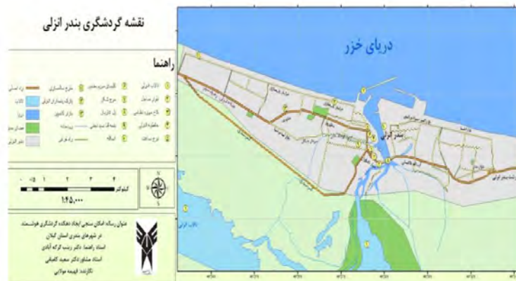
شکل شماره ۱. نقشه گردشگری بندر انزلی

بندر انزلی اولین و بزرگ‌ترین بندر سواحل جنوبی دریای خزر در منطقه‌ای جلگه‌ای و ساحلی در طول جغرافیایی ۴۹ درجه و ۲۸ دقیقه و عرض جغرافیایی ۳۷ درجه و ۲۸ دقیقه واقع شده است و ارتفاع آن از سطح دریا ۲۶- متر می‌باشد. این شهرستان از شمال به دریای خزر، از جنوب به تالاب انزلی، از مشرق به رشت و از مغرب به منطقه طوالش (شهرستان رضوانشهر) محدود می‌شود. در فاصله ۴۰ کیلومتری شهرستان رشت (مرکز استان گیلان) و در منطقه‌ای معتدل واقع شده است و از لحاظ بارندگی یکی از پر باران‌ترین مناطق کشور محسوب می‌شود. شهر بندر انزلی از دو قسمت انزلی و غازیان تشکیل شده است که به وسیله کانال موجود بین این دو قسمت، آب چهار رودخانه - از شرق (سوسر روگا، پیر بازار روگا، راست خانه، نهنگ روگا) و یک رودخانه از غرب (شنبه بازار روگا) - وارد دریا می‌شود. جمعیت شهرستان بندر انزلی بر اساس آمار سال ۱۳۹۵ برابر با ۱۳۹۰۱۶ نفر می‌باشد که ۱۱۸۵۶۴ نفر آن جمعیت شهری است. مساحت شهرستان نیز بالغ بر ۲۹۹ کیلومتر مربع و ۳۳ کیلومتر مربع آن به مساحت شهری اختصاص یافته و از این نظر بندر انزلی از متراکم‌ترین شهرهای ایران محسوب می‌گردد. (سازمان جغرافیایی، ۱۳۹۲: ۲۱۱).