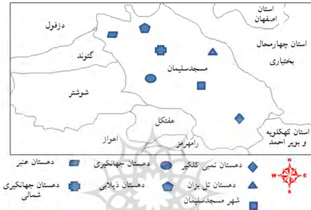
شکل ۱: نقشه موقعیت شهرستان مسجدسلیمان و دهستان های مورد مطالعه

شهرستان مسجدسلیمان مانند بیشتر شهرهای استان خوزستان دارای آب و هوای گرم و نسبتاً خشک می باشد و تابستانی گرم و زمستانی مدیترانه ای دارد. میانگین بارش سالانه باران بالای ۴۰۰ میلی متر و میانگین دما کمتر از ۴- درجه سلسیوس در زمستان و بیش از ۵۰ درجه سلسیوس در تابستان می باشد. بلندترین ارتفاعات استان خوزستان در شهرستان مسجدسلیمان قرار دارد. این ارتفاعات در مناطق شمال و شمال شرقی شهرستان و در منطقه توریستی اندیکا واقع شده اند. مرتفع ترین قله در محدوده شهرستان مسجدسلیمان، کوه کینو با ارتفاع ۳۷۱۰ متر است. دیگر کوه های بلند مسجدسلیمان عبارتند از لیله، تاراز، منار، دلا، آلا، ادیو، شوه، لندر، دلی و آسماری. مهم ترین رودخانه مسجدسلیمان، رود کارون می باشد که از کوه های زاگرس سرچشمه می گیرد و پس از عبور از سدهای شهید عباسپور و مسجدسلیمان از کنار شهر می گذرد. همچنین رودخانه تمبی در جنوب شهر وجود دارد. به دلیل وجود اختلاف ارتفاع بین رودخانه کارون و اراضی کشاورزی، کشت در شهرستان مسجدسلیمان عمدتاً به صورت دیم است. هر چند با ساخت سد گتوند علیا بسیاری از زمین های کشاورزی منطقه به زیر آب رفته اند ولی تاکنون برای بهره برداری و احداث شبکه های آبیاری از دریاچه پشت سد، تمهیداتی لحاظ نشده است و کشاورزی به دلیل محدودیت منابع آب و خاک از رونق چندانی برخوردار نیست و بالعکس دامپروری و دامداری رونق و اهمیت فراوانی دارند.