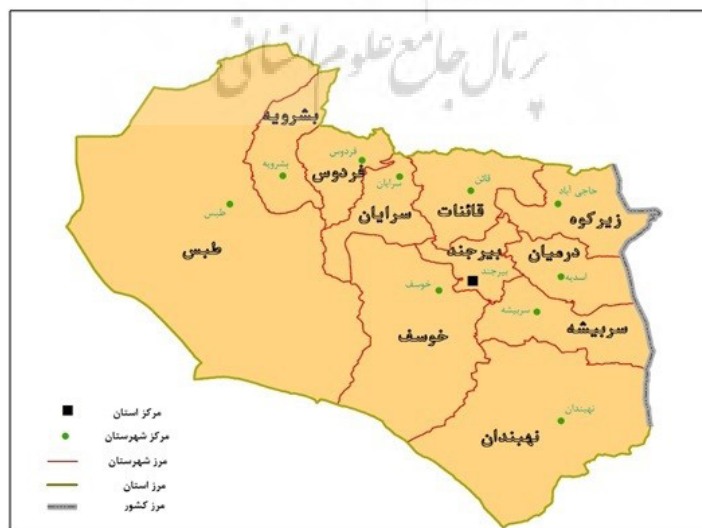
تصویر ۲. نقشه تقسیمات سیاسی استان خراسان جنوبی.

استان خراسان جنوبی در شرق ایران و حاشیه شمال شرقی دشت لوت قرار دارد و مرکز آن شهر بیرجند است. این استان با ۹/۱۴ درصد از وسعت کشور (۱۵۱۱۹۳ کیلومترمربع)، سومین استان وسیع کشور محسوب می‌شود. استان خراسان جنوبی، با مصوبه مجلس شورای اسلامی و پس از تقسیم استان خراسان به سه استان، در سال ۱۳۸۲ ایجاد شد. بر اساس سرشماری سال ۱۳۹۵، جمعیت آن برابر با ۷۶۸۸۹۸ نفر است، که از این نظر بیست و هشتمین استان کشور شناخته می‌شود و دارای ۱۱ شهرستان، ۲۵ بخش، ۶۱ دهستان و ۲۸ شهر است. از کل جمعیت استان، ۵۹/۰۲ درصد در سکونتگاه‌های شهری و ۴۰/۹۸ درصد در سکونتگاه‌های روستایی زندگی می‌کنند. شهرستان بیرجند با ۲۶۱۳۲۴ نفر پرجمعیت‌ترین شهرستان استان و مرکز آن است (تصویر شماره ۲). در سال ۱۳۹۵ خراسان جنوبی از ۳۲۲۷ آبادی برخوردار بوده است. از این تعداد فقط ۱۷۸۱ مورد شامل آبادی‌های تخلیه‌شده از جمعیت و ۱۴۴۶ مورد شامل آبادی‌های دارای جمعیت هستند. بنابراین ۵۵/۲ درصد از آبادی‌های موجود در خراسان جنوبی فاقد جمعیت گزارش شده‌اند و تنها ۴۴/۸ درصد از آن‌ها از جمعیت ساکن برخوردارند. قابل توجه است که، از کل روستاهای دارای جمعیت، ۱۳۱۱ سکونتگاه برابر با ۹۱ درصد از آن‌ها، کمتر از ۵۰۰ نفر جمعیت دارند و تنها ۴۶/۴ درصد از کل جمعیت روستایی استان را در خود اسکان داده‌اند (Statistical Centre of Iran, 2016). این وضعیت گویای شکنندگی و آسیب‌پذیری نواحی روستایی استان در برابر مهاجرت بی‌رویه