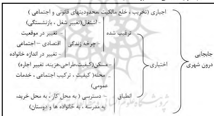
شکل ۱- انواع و دلایل جابجایی درون شهری خانواده ها

جمعیت شناسی مانند ازدواج ، تولد یک کودک از مهمترین عوامل فشار است، زیرا تغییرات در نیازهای مسکن را بدنبال دارد (Vorel et al, 2015:33). عوامل برانگیزاننده خانواده‌ها تابعی از وضعیت خانوادگی، درآمد، شیوهی زندگی و وضعیت مسکن این خانواده‌ها می‌باشد (Robson, 1975: 33). بدون شک عامل بسیار مهم در تصمیم گیری به هنگام انتخاب مسکن، میزان درآمد می باشد. روشن است که در داخل شهرها خانواده هایی از تحرک بیشتری برخوردارند که از درآمد و پایگاه اجتماعی پردوامی بهره مندند. خانواده های سنتی و خانواده هایی که ابعاد محدودتری دارند کمتر به جابجایی علاقه نشان می دهند. بر عکس خانواده های جوان بیشتر تن به انتقال محل سکونت می دهند (Shakuyi, 2010:44). همچنین تحرک سکونتی ممکن است تحت تأثیر عواملی چون نزدیکی به محل کار، مدت سکونت، وضعیت اشتغال، سن، جنس باشد (Weiping, 2006: 747). تحرک سکونتی می‌تواند اختیاری یا غیراختیاری باشد. دلایل عمده‌ی جابه‌جایی درون شهری خانواده‌ها را می‌توان به صورت زیر نشان داد (Pacione, 2005:203):