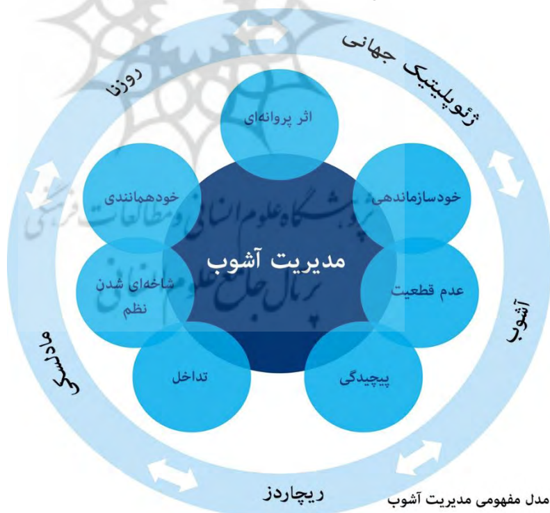
شکل (۲): مدل سیکلی مدیریت آشوب در ژئوپلیتیک جهانی

را نیز دچار دگردیسی‌های ساختاری-سازه‌ای می‌کند. این پویاها همچنین پیامدهایی را بر ساختار ژئوپلیتیکی و ثبات نظام به همراه خواهد داشت (Rosenau, 2001: 135). از این منظر فضای آشوب ژئوپلیتیکی را باید در دو سطح راهبردی و اجرایی، مدیریت کرد: در بخش راهبردی این مدیریت باید از طریق الف) محدودسازی تهدیدات مشترک ب) افزایش شبکه‌های اطلاعاتی ج) عملیات سریع و تصاعدیابنده و در نهایت د) پیوند فراساختارها انجام گرفته و در حوزه اجرایی به واسطه؛ الف) ارائه دستورکار موقت و میان‌مدت ب) مدیریت بحران ج) اولویت‌دهی به نیازها و ضرورت‌ها شکل‌بندی شود. شکل (۲) مجموعه مفهومی مدیریت سیستم آشوب که دربرگیرنده، نظریه‌پردازان، مولفه‌ها و ویژگی‌های آشوب در قالب یک سیکل درونی و بیرونی و مدیریت فرآیندهای آشوبناک بازنمایی و ساده‌سازی شده است.