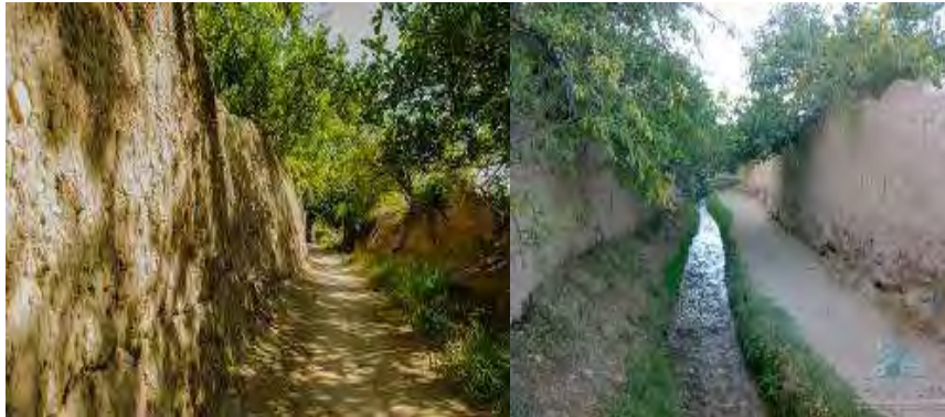
شکل ۲. کوچه‌باغ‌های کویری و درختان توت سمنان با جداره‌های کاه‌گلی

کوچه باغ‌های متعدد و گوناگونی در بیشتر روستاها و شهرهای ایران وجود دارد که بعضی از آنها هنوز هم به قوت خود باقی هستند؛ از جمله کوچه‌باغ‌های شیراز، تیران و کرون، کوچه‌باغ تبریز، کوچه‌باغ‌های سمنان و... که با اشکال متنوع و منحصر به فرد به‌طور تدریجی به وجود آمده‌اند. بعضی از کوچه‌باغ‌های یادشده در زیر توصیف شده‌اند.