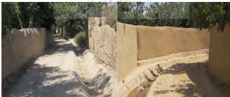
شکل ۸. کوچه‌باغ‌های تیران و کرون در استان اصفهان

کوچه‌باغ‌های تیران در مقایسه با دیگر کوچه‌باغ‌ها از ویژگی‌های خاصی برخوردارند و نگهداری از آنها هویت و میراث گذشتگان را زنده نگه می‌دارد؛ پیچ‌های پی‌درپی و باریک از ویژگی‌های منحصربه‌فرد این کوچه‌باغ‌هاست. در گذشته مردم این شهر با حیوانات اهلی باربر مانند الاغ، بارها و محصولات خود را جابه‌جا می‌کردند و از این کوچه‌ها تنها حیوانات و دوچرخه و موتورسیکلت قادر به تردد بود؛ اما با گذر زمان و حضور خودرو در زندگی بشر، این کوچه‌ها برای تردد ماشین‌ها پهن شدند و کم‌کم هویت اصلی خود را از دست دادند. ساخت‌وسازها و تغییر دیوارهای گلی به دیوارهای سیمانی، تهدیدی است که این آثار تاریخی را نابود می‌کند و هویت اصلی آنها را از کوچه‌های خاکی، تنگ و پیچ‌درپیچ با دیوارهای گلی به سمت کوچه‌های بزرگ با دیوارهای سنگی تغییر می‌دهد. در جمع‌بندی کلی تنگی کوچه‌ها، وجود دیوارهای گلی، پیچ‌وخم‌ها و درهای سنگی از ویژگی‌های منحصربه‌فرد این کوچه‌باغ‌ها در مقایسه با سایر کوچه‌باغ‌ها و مزارع کشاورزی است که در ثبت ملی این آثار مؤثر واقع می‌شود.