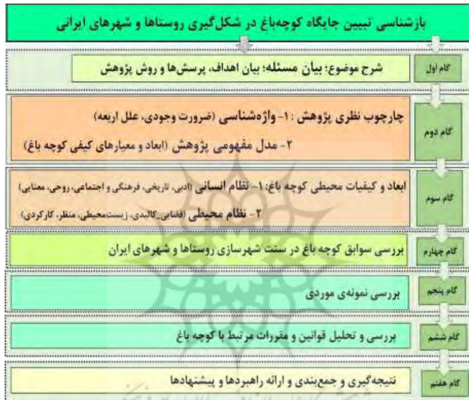
شکل ۱. دیاگرام فرایند انجام پژوهش (نگارنده، ۱۳۹۹)

بررسی نمونه‌های موردی انجام می‌شود. فرایند پژوهش به این صورت است که نخست مسئله پژوهش و روش پژوهش مطرح و جایگاه طبیعت در ادبیات ایرانی بررسی می‌شود؛ سپس واژه‌شناسی کوچه‌باغ با تأکید بر دوره صفوی و پس از آن، شرایط شکل‌گیری و تعریف و ضرورت وجودی کوچه‌باغ، علل اربعه و ارزش‌های کوچه‌باغ مطالعه می‌شود؛ در ادامه ابعاد احساسی، روانی و عرفانی کوچه‌باغ و پس از آن کوچه‌باغ و باغ‌محله در سنت شهرسازی ایران در قالب نمونه‌های موردی بررسی می‌شود؛ در نهایت با جمع‌بندی و نتیجه‌گیری، راهبردهایی برای حفاظت از کوچه‌باغ‌ها و توسعه الگوی کوچه‌باغ‌ها در نظام شهرسازی و معماری روستاها و شهرهای ایران ارائه خواهد شد.