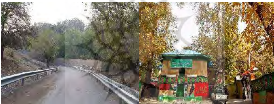
شکل ۴. کوچه‌باغ‌های کن، بافت شهری کن آمیخته با فرهنگ زندگی ساکنان؛ http://Tehran.ir

کن بیش از هزار سال قدمت دارد و هنوز جوی‌های آب در کوچه‌پس‌کوچه‌هایش می‌خروشد. در کوچه‌باغ‌های باریک و سرایشی‌های کن به سمت امامزاده، درختان بزرگ و کهنسال گردو و چنار با قدمتی چند صدساله و شاخ و برگ‌های بزرگ و درهم‌تنیده، سایه خود را پهن کرده‌اند. باغیان‌های کن هنوز هم در حال چیدن خرمالوهای باغ هستند.