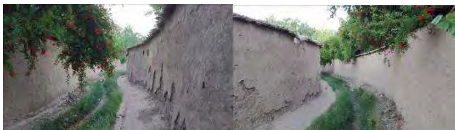
شکل ۹. کوچه‌باغ‌های نیریز با درختان انار

نیریز، شهری در استان فارس است که باغ‌های انار و انار آن شهرت جهانی دارد و برندی طبیعی و باهویت برای این شهر محسوب می‌شود. دیوارهای باغ قدیمی اندود کاه‌گلی است و جوی آب سستی از میان این کوچه‌باغ‌ها می‌گذرد. کوچه‌باغ‌های ارزشمند و سستی این شهر که تسلط درختان انار و میوه‌های انار از بالای دیوار آنها مشهود است، بر حواس پنجگانه انسان تأثیر می‌گذارند.