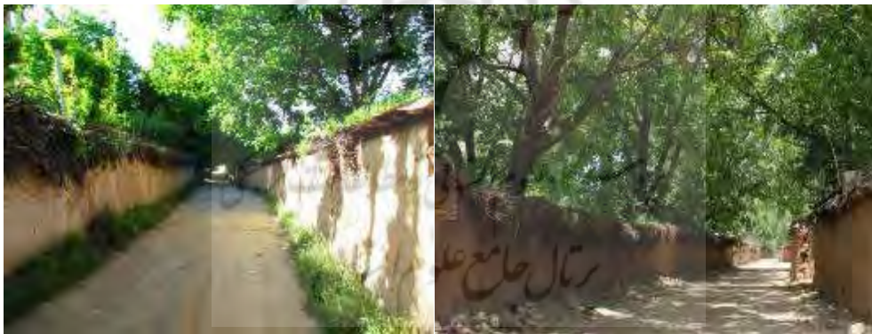
شکل ۶. محله قصرالدشت شیراز با طبیعتی چندصدساله؛ http://www.shiraz.ir

باغ‌های قصرالدشت شیراز در فصل بهار به «باغ بهشتی» شهرت دارند؛ زیرا هوا در این فصل بسیار مطبوع و برگ درختان سرسبز است، گل‌ها می‌رویند و همه‌جا عطر خوش بهارنارنج پخش خواهد شد. ابتدای کوچه‌های معروف یورد دینکان، رودخانه‌ای دائمی وجود دارد که از سرقنات‌های شیراز سرچشمه می‌گیرد؛ کوچه‌هایی که هر دو طرف را درختان میوه پر کرده‌اند. بوی درخت گردو در طول مسیر کوچه‌های یورد به مشام می‌رسد.