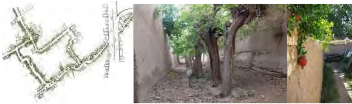
شکل ۷. کوچه‌باغ‌های یزد (دهقان‌پور هنزایی و پوراحمدی لاله، ۱۳۹۶: ۱۲)