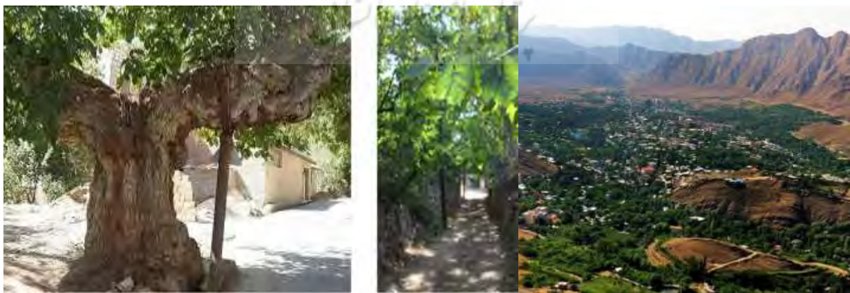
شکل ۵. کوچه‌باغ‌های شه‌میرزاد با درختان کهنسال؛ http://www.isna.ir

شغل مردم شه‌میرزاد، باغداری، کشاورزی، زنبورداری، دامداری، خدمات تجاری و دولتی است. از شاخصه‌های شه‌میرزاد، کشت و صنعت این شهر و وجود باغ‌های زیاد گردوست؛ به طوری که به‌مثابه بزرگ‌ترین باغ‌گردوی جهان شناخته شده است. این باغ بزرگ گردو با ۷۰۰ هکتار وسعت، در سال ۱۳۸۸ حدود ۱۳ هزار نفر سهام‌دار داشته است (قاسمی شه‌میرزادی، ۱۳۷۹: ۱۲-۱۵). شرکت کشت و صنعت شه‌میرزاد در سال ۱۳۶۷ به همت جمعی از اهالی این شهر تأسیس شد و به‌منزله شرکت سهامی خاص به ثبت رسید.