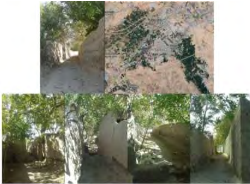
شکل ۱۱. کوچه‌باغ‌های سردرود (نگارنده، ۱۳۹۹)