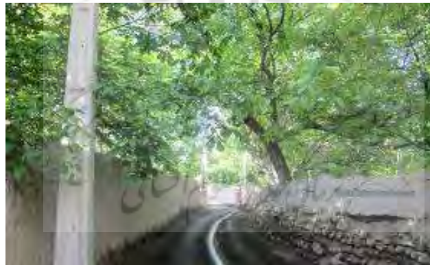
شکل ۳. کوچه‌باغی در محله کوچه‌باغ تبریز ( http://www.naznews.ir )

یکی از محلات قدیمی شهر تبریز بین محلات قره‌آغاج، فیروز، گجیل و آخونی است. یکی از معروف‌ترین ویژگی‌های محله قدیمی کوچه‌باغ، وجود چشمه‌های پرآب بوده است. مجاورت کوچه‌باغ با چشمه گول‌باشی موجب شده است مردم این قسمت از کوچه‌باغ را با نام «محله گول‌باشی» بشناسند.